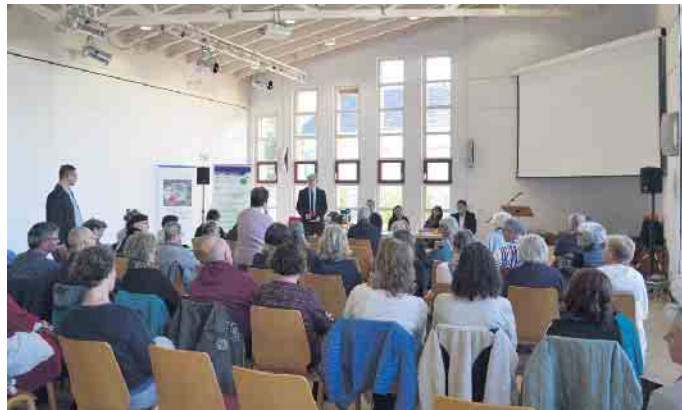
Der Förderverein des Urbacher Hospizes An St. Bartholomäus war einer der beiden Ausrichter des Hospiztages.