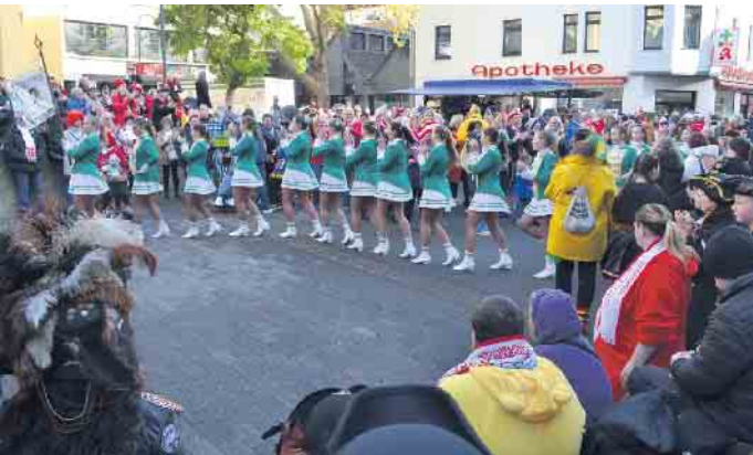
Auch ein Bühnenprogramm gehört zum Sessionsauftakt am Elften Elften in Porz-Mitte.