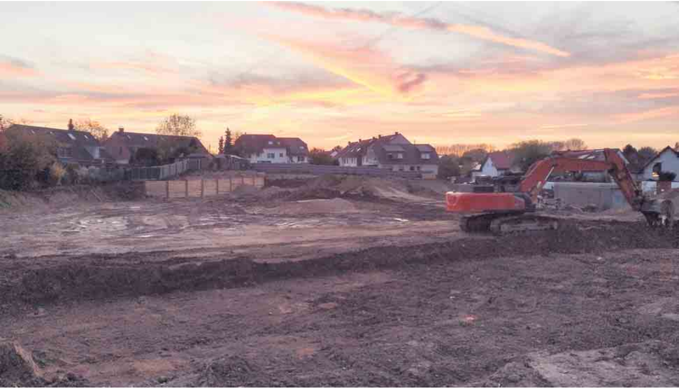
Text und Foto: Lars Göllnitz