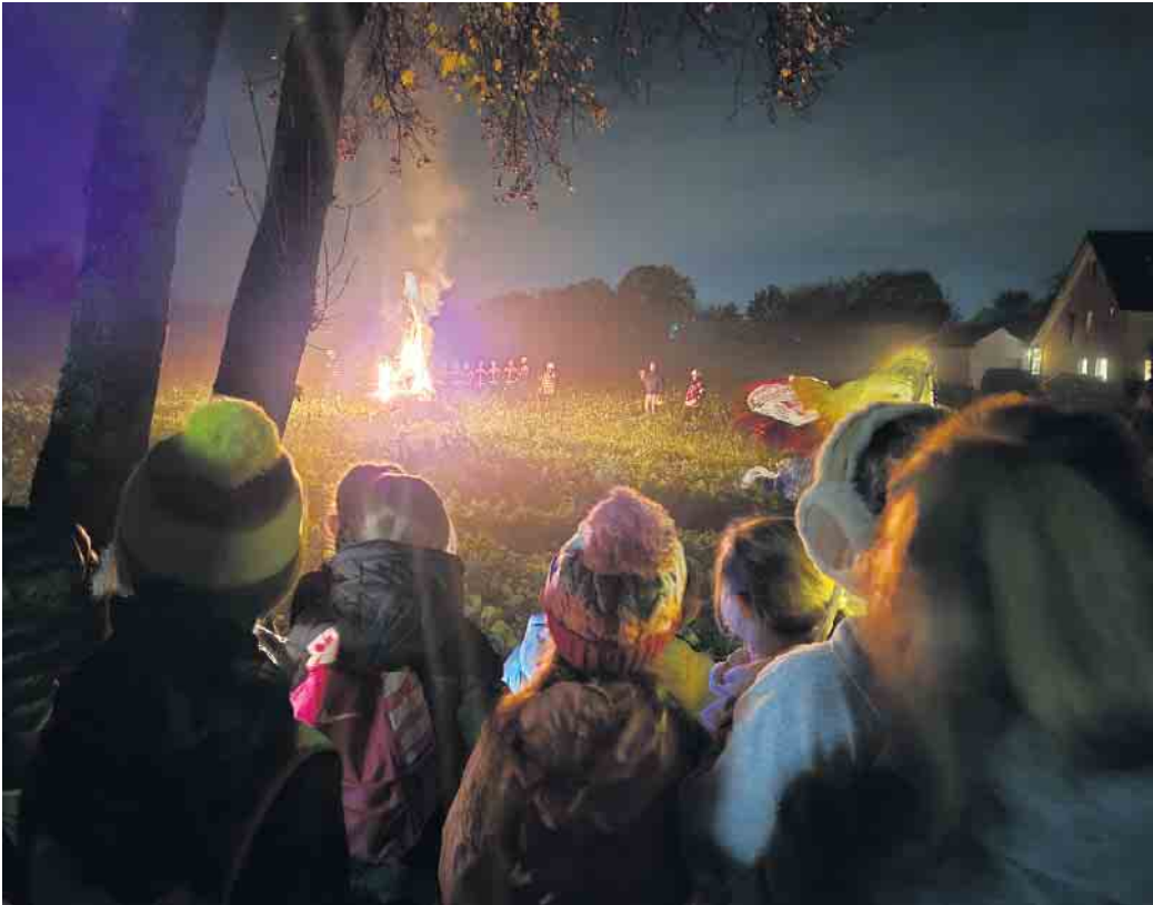
Blick auf das Martinsfeuer beim Martinszug in Lind

Finken- berg - Am Freitag, 21. No- vember, findet im Bürgerzentrum Fin- ken- berg eine Lesung mit Experten- talk und Kunst statt. Von 17 bis 19 Uhr wird aus dem diesjährigen Buch für die Stadt, „Liebe ist gewal- tig“ von Claudia Schumacher, ge- lesen. Den Expert*innen-Talk zu häus- licher Gewalt moderiert Ina Philipp- sen-Schmidt. Parallel zu Lesung und Talk malt eine Künstlerin vor Ort ein Kunstwerk. Der Eintritt ist frei. (red.)