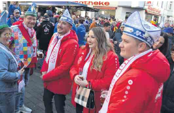
Das designierte Porzer Dreigestirn inmitten der Feiernden.

dabei - gekleidet in rot-weißer Festausschuss-Montur. Die Session, mit Pause zu Weihnachten und Jahreswechsel, reicht im kommenden Jahr bis Mitte Februar. Rosensonntag liegt auf dem 15. Februar. (Lars Göllnitz - der Autor bei Instagram: @enqoozee)