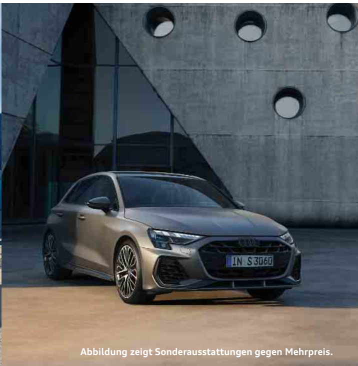
Abbildung zeigt Sonderausstattungen gegen Mehrpreis.

Kraftstoffverbrauch (kombiniert): 5,5 l/100km; CO2-Emissionen (kombiniert): 126 g/km; CO2-Klasse: D