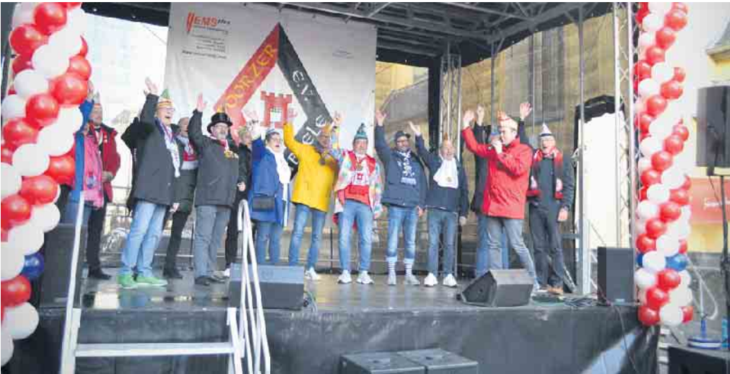
Die Präsident*innen der Porzer Gesellschaften auf der Bühne um 11:11 Uhr.

Festausschuss und Poorzer Nubbele haben wieder gemeinsam den Auftakt in die Närrische Zeit gestaltet