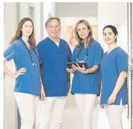
Das Team der dental suite im Kölner Rheinauhafen

Darüber hinaus kommt die Methode auch Angstpatienten sehr entgegen, da der gesamte Behandlungszeitraum (inklusive Vorbereitung und Nachbehandlung) sehr kurz gehalten werden kann.