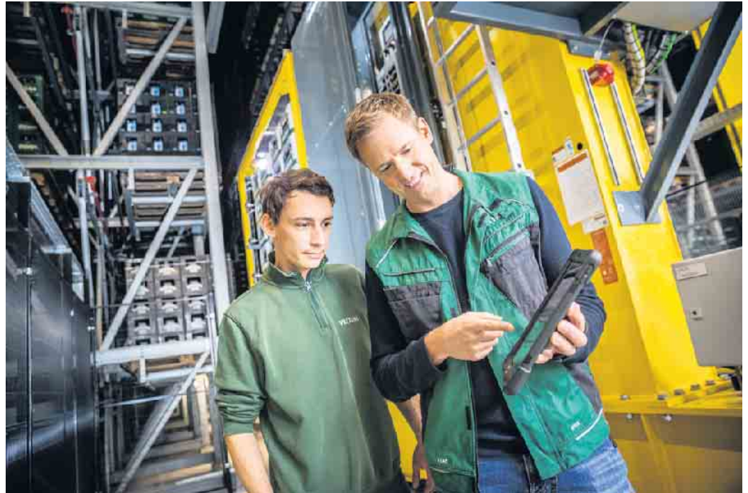
Die Ausbildung zur Fachkraft für Lagerlogistik in der Brauerei dauert drei Jahre, Voraussetzung ist ein Hauptschulabschluss.

Bei der Brauerei C. & A. Veltins beispielsweise finden Auszubildende zur Fachkraft für Lagerlogistik