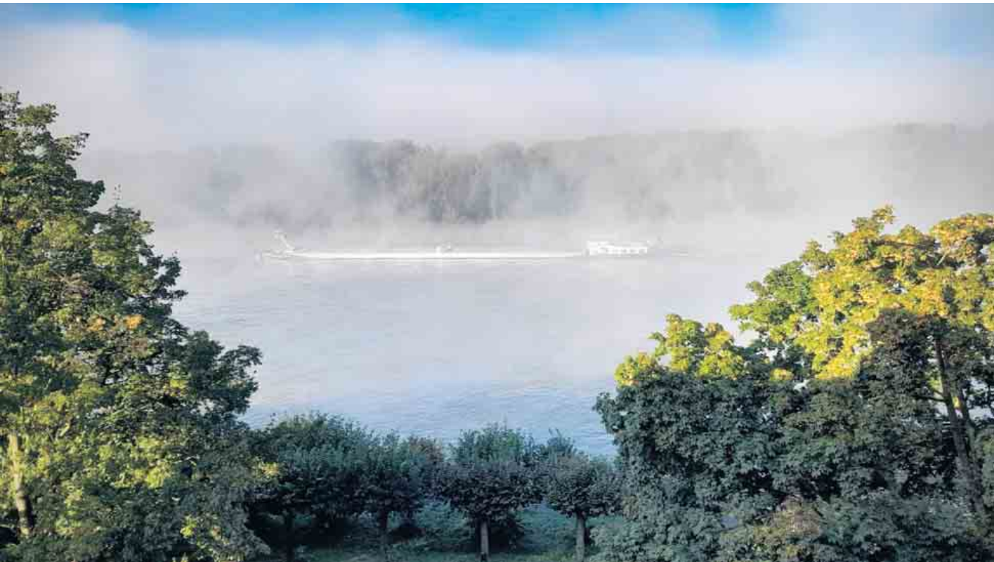
Text: Lars Göllnitz, Foto: privat