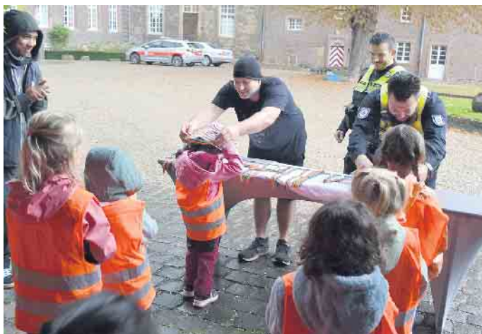
Auch Mitarbeiter des Ordnungsamtes haben sich beim Müllsammeln engagiert.

und die Eigentümerfamilie Eltz-Rübenach stellen das Schloss zur Verfügung“, so Bleike. Vor Ort richtet er so einen Workshop zum Thema Müll für die Kita-Kinder aus - mit dabei auch Mitarbeitende der Uni Köln. Zudem habe es reichlich Spenden von Unternehmen gegeben, berichtet Bleike.