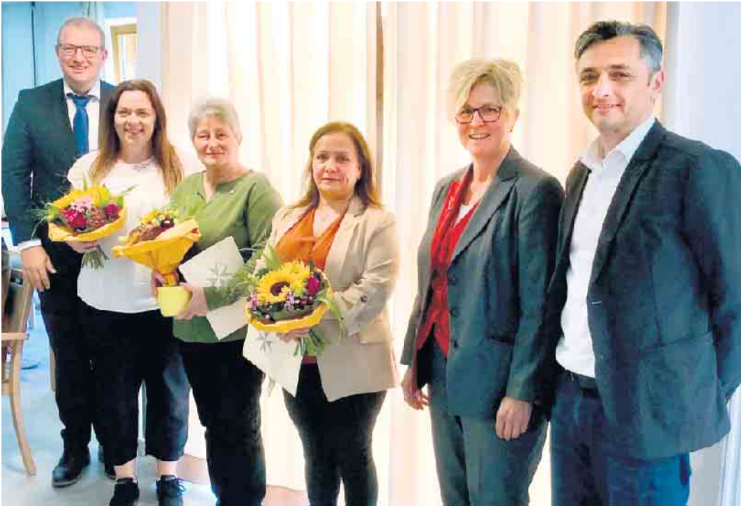
Nicht nur die Einrichtung feiert Jubiläum, auch langjährige Mitarbeitende wurden bei der Feier geehrt.