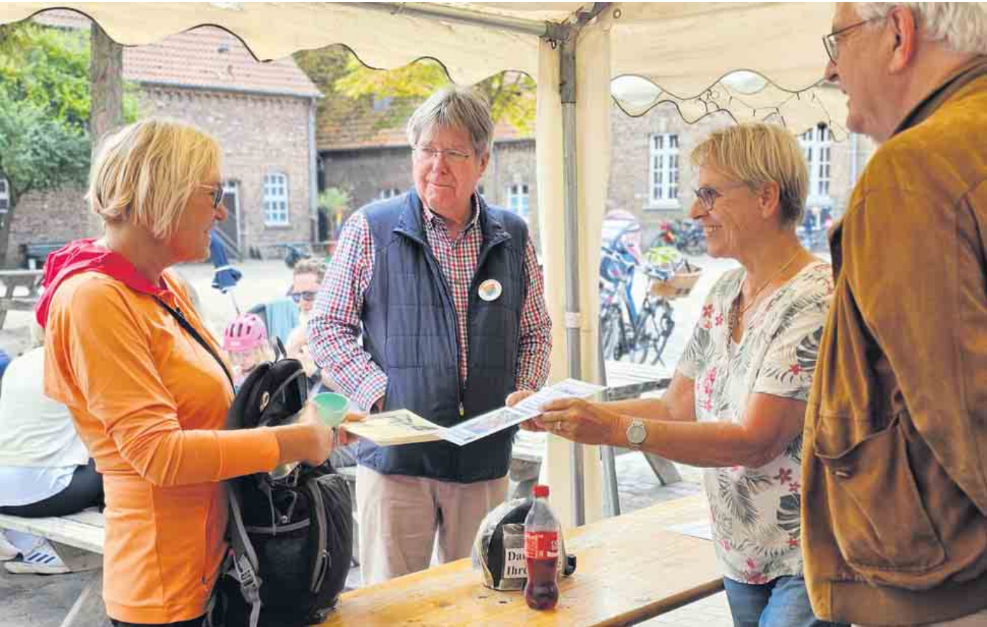
Text: Lars Göllnitz, Foto: Bürgervereinigung Ensens-Westhoven