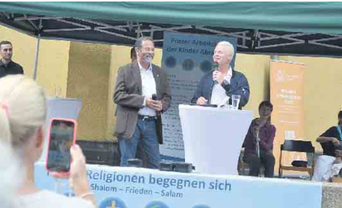
„Demokratie heißt gemeinsam“, so Moderator und Entertainer Guido Cantz.

Die Porzer Religionsgemeinschaften haben zur Kundgebung auf die Bahnhofstraße geladen - mit dabei Poetry Slams, Musik und Entertainer und Moderator Guido Cantz