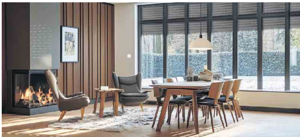
Trend 1: Große bodengebundene Fenster lassen viel Tageslicht herein. Und sparen im Winter viel Heizenergie.

Große Fensteranlagen zur Terrasse hin gehören schon länger zum Standard bei Einfamilienhäusern. Häufig kommen hier großflächige Hebe- und Schiebetüren oder bodengebundene Fenster oder Türen zum Einsatz. Diese Schiebekonstruktionen bieten eine größere Türöffnung als Fenstertüren und können beinahe die gesamte Fensterfront leichtgängig verschwinden lassen. „Die Glastür gleitet zurück und schon erweitert sich das Wohnzim-