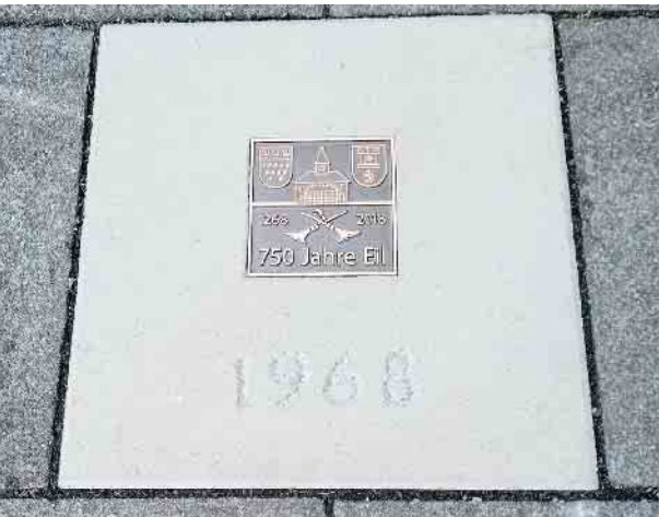
So schauen die Bronzeplatten aus.

Eil - Der Ortsring Eil hat im September 2023 seinen „Kulturpfad Besenbinderdorf Eil“ eröffnet. An einer Stele auf dem Besenbinderplatz an der Frankfurter Straße sind die derzeit dreizehn Stationen aufgeführt. Zur Visualisierung vor Ort werden an den verschiedenen Orten Bronzetafeln in den Boden eingelassen. Sie erinnern zudem an die 750-Jahre-Feiern Eils im Jahr 2018. Sieben Bronzetafeln sind bereits verlegt. Die erste Tafel wurde vor der Bäckerei Hardt an der Frankfurter Straße angebracht. Es folgte die Platte vor der Firma Langel an der Heumarer Straße, eine Platte vor der Stele am Besenbinderplatz, eine an der Düsseldorfer Straße vor dem Wappen von Eil, eine Platte am Festbaum auf dem Pfarrer-Oermann-Platz, eine Platte an der Berger Straße gegenüber der Tankstelle. Platte Nummer sieben ist in der Ludwigstraße vor Haus Nummer 17 zu finden. Eine achte Platte wurde an der Berger Straße 134 vor einer historischen Fototafel des Ortsrings verlegt. Die historische Fototafel erinnern an das Aussehen der Umgebung in früheren Jahren. Die Inschrift auf der Platte, „1968“, erinnert indes an das Baujahr des Hauses Nummer 134. Erbaut, genau 700 Jahre nach der ersten nachgewiesenen urkundlichen Erwähnung Eils im Jahr 1268. (red.)