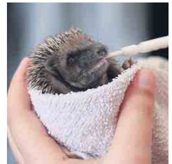
In der Igel-Auffangstation werden die Tiere behandelt und gepflegt.