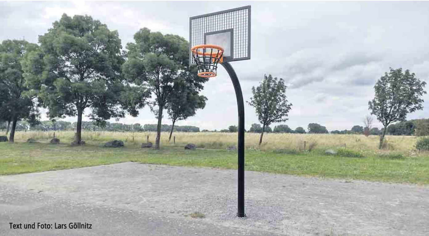
Text und Foto: Lars Göllnitz