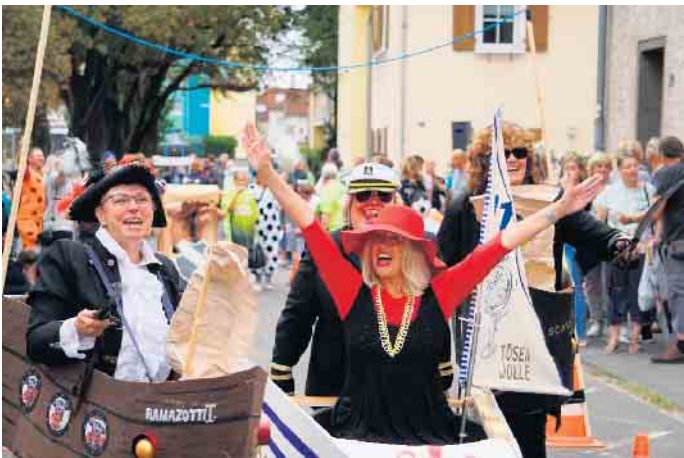
Bunt geschmückt machen sich die Karren auf den Weg durch die Kupfergasse.

Urbach - Am Samstag, 31. August, fahren ab 14 Uhr wieder Schürresskarren durch die Urbacher Kupfergasse. Anwohnende der Straße organisieren das Rennen erneut in Kooperation mit dem RSV Urbach und setzen damit eine Tradition fort. Ursprünglich lieferten sich Knechte und Mägde mit den nur geringfügig gereinigten Mistkarren einen Wettstreit durch das Dorf. Beim traditionellen Schürreskarrenrennen sind nun bunt geschmückte Karren der Vereine aus Urbach und den umliegenden Stadtteilen mit dabei. Meldeschluss ist am Veranstaltungstag um 13 Uhr. Zur besseren Vorbereitung freuen sich die Veranstalter über Meldungen per E-Mail: vorab an rainer.czakalla@netcologne.de .