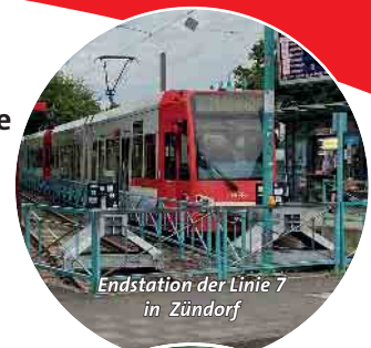
Endstation der Linie 7 in Zündorf

Ihre SPD-Fraktion in der Bezirksvertretung Porz