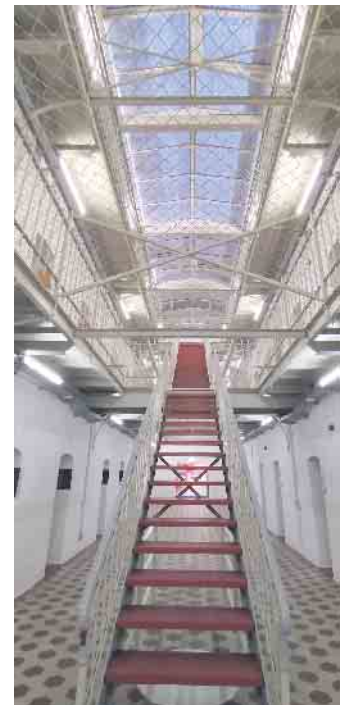
In Trakt B waren die Freikaufhäftlinge eingesperrt. Wegen des DDR-Freikaufbeauftragten Dr. Wolfgang Vogel wurde er auch „Vogel-Käfig“ genannt.