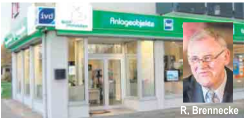
Im Zentrum von Porz: Goethestraße / Ecke Bahnhofstraße