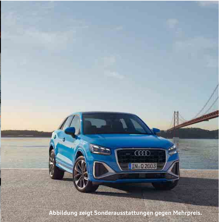
Abbildung zeigt Sonderausstattungen gegen Mehrpreis.

Kraftstoffverbrauch (kombiniert): 5,3 l/100km; CO2-Emissionen (kombiniert): 120 g/km; CO2-Klasse: D