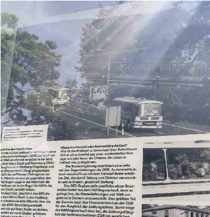
Die damaligen Busse zum Gefangenenfreikauf: Im Lern- und Gedenkort Kaßberg-Gefängnis in Chemnitz wird die Zeit aufbereitet und dokumentiert.