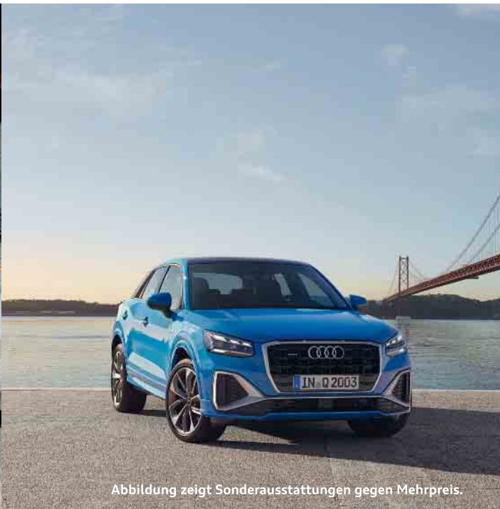
Abbildung zeigt Sonderausstattungen gegen Mehrpreis.

Kraftstoffverbrauch (kombiniert): 5,3 l/100km; CO2-Emissionen (kombiniert): 120 g/km; CO2-Klasse: D