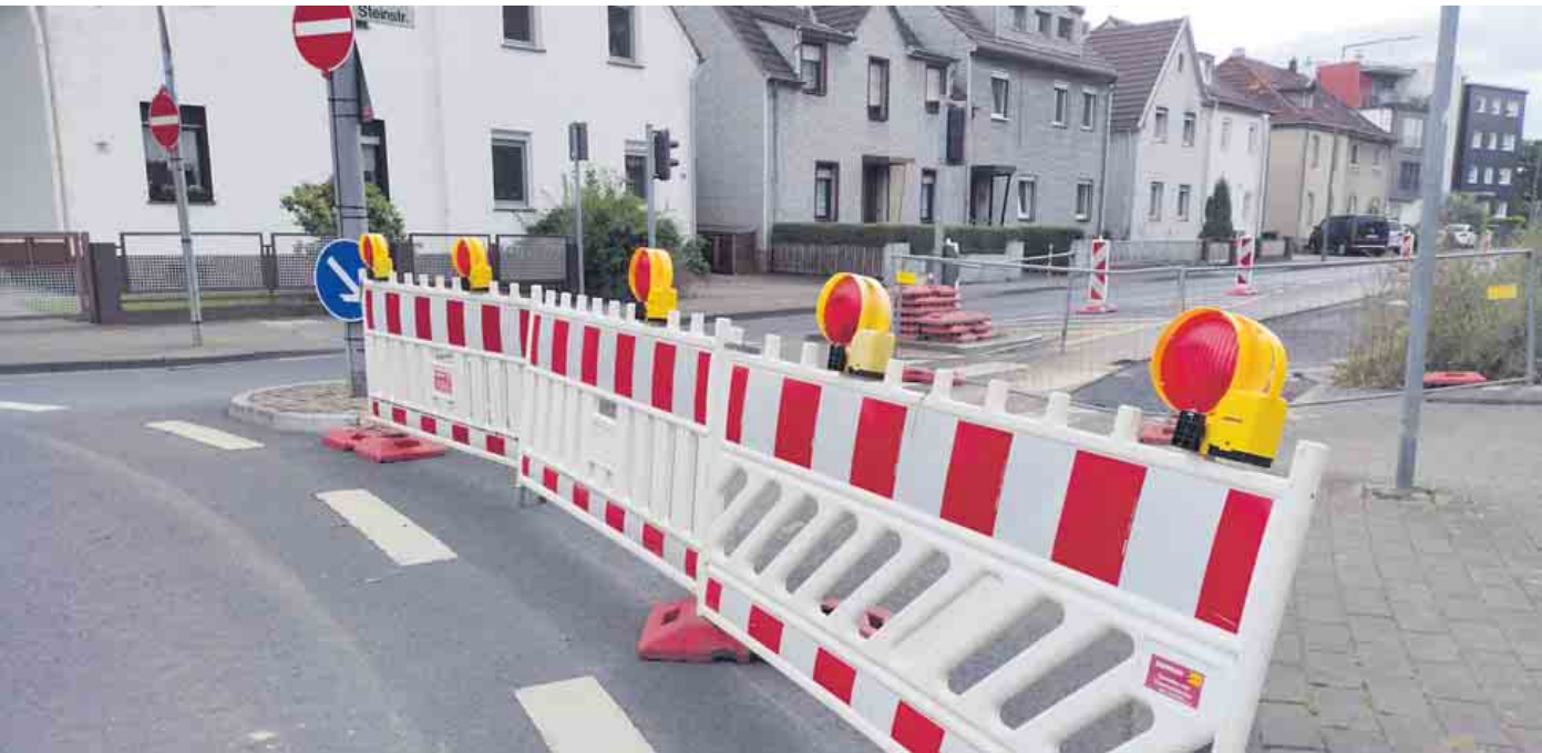
Text und Foto: Lars Göllnitz