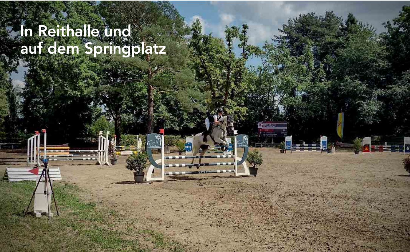
In Reithalle und auf dem Springplatz