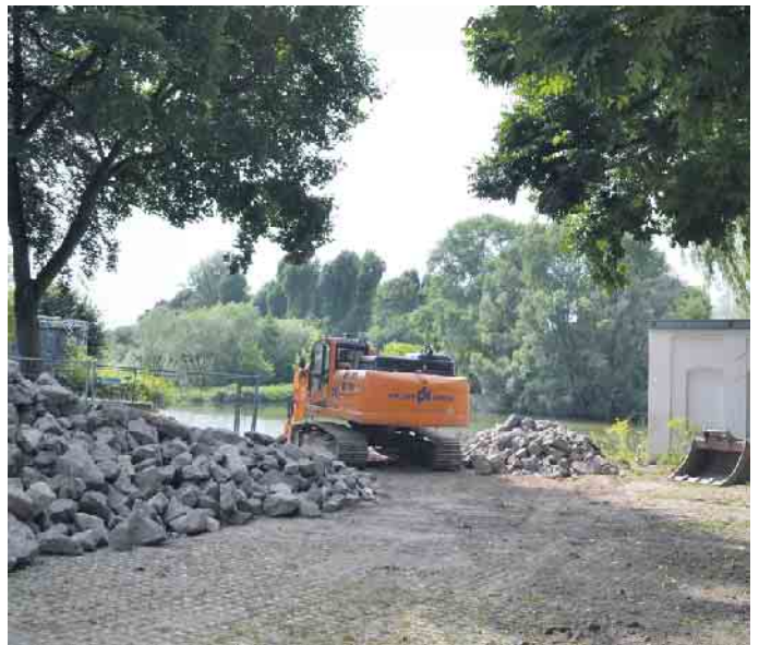
Das Teehaus in Zündorf soll nach Wunsch der BV erhalten oder neu aufgebaut werden.

Ebenfalls einstimmig hat die BV über den zuvor vom Rat der Stadt Köln gefällten Beschluss zum Neubau einer Grundschule in Elsdorf entschieden. Diese solle demnach als Clustergrundschule an der Friedensstraße und mit Zweifeldsporthalle, Hausmeisterwohnung sowie Außenanlage entstehen. Nach aktuellen Schätzungen soll der durch die Kölner Schulbaugesellschaft mbH umgesetzte Maßnahme etwa 36 Millionen Euro kosten. Mehrheitlich bei Enthaltung von BSW und AfD hat die BV beschlossen, den Rat der Stadt Köln zu bitten, die Verwaltung zu beauftragen, keine Räume in Schulen, Bürgerhäusern oder Jugendzentren an als gesichert rechtsextremistische geltende Parteien und ihr nahestehende Organisationen zu vermieten oder zu überlassen. Die Verwaltung werde beauftragt, bestehende Regelungen der Nutzungs- und Vermietungsbedingungen anzuwenden oder anzupassen und bestehende Mietverträge dahingehend zu überprüfen, so die BV.