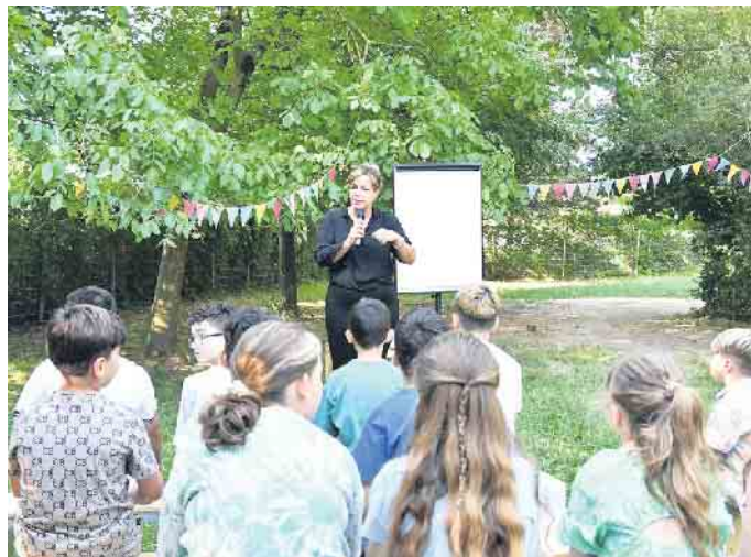
Mona Neubaur spricht zu den Schülern

Verantwortliche der Bürgerstiftung nach dem Besuch der stellvertretenden Ministerpräsidentin: „Der Besuch der Ministerin ist eine große Ehre und gibt zu erkennen, dass unser Engagement auch über die Grenzen des Stadtbezirkes wahrgenommen wird.“ (red.)