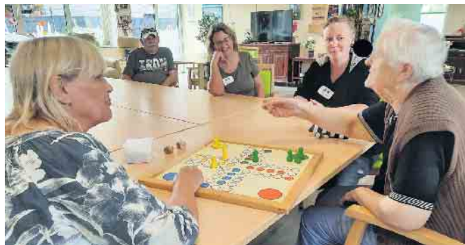
Auch Gesellschaftsspiele werden regelmäßig gespielt.