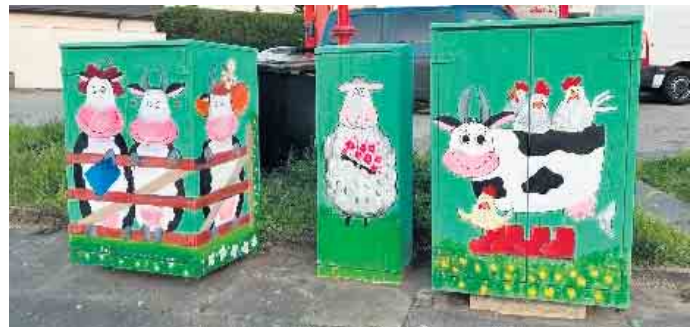
Nach dem Anstrich erscheinen die Stromkästen bunt und farbenfroh.

Dieser besteht aus Mitgliedern des Vereins, die sich für Kreatives begeistern und den Stadtteil verschönern wollen. So wurde etwa schon der Patenschaftswald der GOG vor der Peter-Petersen-Grundschule mit diversen Kunstwerken ausgestattet. Seit März 2021 kümmert sich Hahnemann-Schramm zusammen mit einer Gruppe von Freizeitkünstler*innen um die