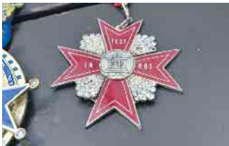
Einst wurden die Orden handgefertigt - so wie dieses Stück aus den 1950er Jahren.

sein ältestes Stück von 1838. Die Ordenssammlung der Porzer Dreigestirn ist komplett. Der erste datiert zurück aufs Jahr 1931. Und er hängt, wie viele ausgewählte Orden, in seinem Restaurant am Zündorfer Markt. Im Landhaus Zündorf begegnen sie den Speisenden an den Wänden, in Vitrinen und Schaukästen.