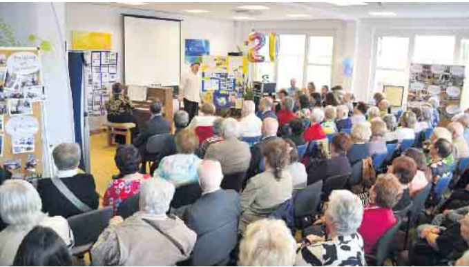
Zur Feier gab es Musik und reichlich Andrang.

verlassen haben oder mussten, erzählt Natalia Töpfer. „Wir geben den Menschen das Gefühl, dass auch ihre Muttersprache und Kultur nicht in Vergessenheit gerät.“ Sie selbst wisse, was es bedeute, Integration zu leben, so Töpfer. „Wir alle wünschen uns, dass das jüdische Leben in Porz weitergeht.“ Das Begegnungszentrum sei nichts anderes als ein Diamant der Synagogengemeinde, so Rado. „Ein Erfolg sondergleichen.“ (Lars Göllnitz - der Autor bei Instagram: @enqoozee) - Liebe Leser*innen, vielleicht haben Sie es gemerkt. Dieser Artikel sollte eigentlich als Titelstory der vergangenen Ausgabe erscheinen. Bedingt durch einen produktionstechnischen Fehler erschien aber nur das Titelbild. Daher heute in dieser Ausgabe der komplette Text. Ihr Porz am Montag-Team.