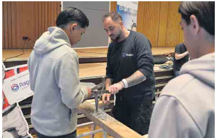
Praktisches Ausprobieren steht bei vielen Ständen, vor allem im Handwerk, im Mittelpunkt.

an. „Klar“, lautet die Antwort. Und schon startet das Gespräch. Im besten Fall ist der Weg zur Ausbildungsstelle so schnell und direkt bei der Ausbildungsbörse, die der Verein Eigenart unter dem Titel „Berufsforum“ im Porzer Bezirksrathaus ausrichtet - in Kooperation mit dem Porzer Bezirksamt. Insgesamt 45 Betriebe, Unternehmen, Institutionen und Organisationen hat Eigenart, die auch Berufsvorbereitungskurse an vielen Kölner Schulen ausrichten, ins Bezirksrathaus gelockt. Darunter auch große, wie die Deutsche Post, Rewe oder auch die Bundespolizei. Überall würden händierend Auszubildende gesucht, herrsche Fachkräftemangel, berichtet auch