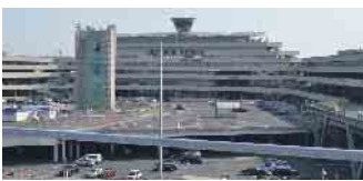
Der Flughafen Köln/Bonn und sein markantes Terminal 1: Hier kam Brian Eno 1978 auf die Idee zu Ambient-Musik.

sein, um Gespräche zu übertönen. Auch müsse sie Ansagen möglich machen. Mit dem Album „Ambient 1: Music for Airports“, das bereits ein Jahr später erschien, erschuf Eno danach Ambient Music. Ein komplett neues Genre, das bis heute wirkt und nichts mit platter Fahrstuhlmusik zu tun hat. „Ich dachte damals: Ich wünsche es gebe eine andere Art von Musik“, erzählt Brian Eno. Die Disco-Musik habe einfach nicht gepasst. Für „Ambient 1: Music for Airports“ hat Eno vier Kompositionen kombiniert, die wiederum aus wiederkehrenden Tonbandloops bestehen. Musik, die so als endlos abspielbare, aber nicht langweilig werdende Klanginstallation und Untermalung abgespielt werden kann. Und, die die oft hektische Atmosphäre in einem Flughafenterminal entspannen soll. Im Booklet zum Album heißt es: „Ambient-Musik muss in der Lage sein, viele Aufmerksamkeitsebenen des Hörers zu berücksichtigen.“