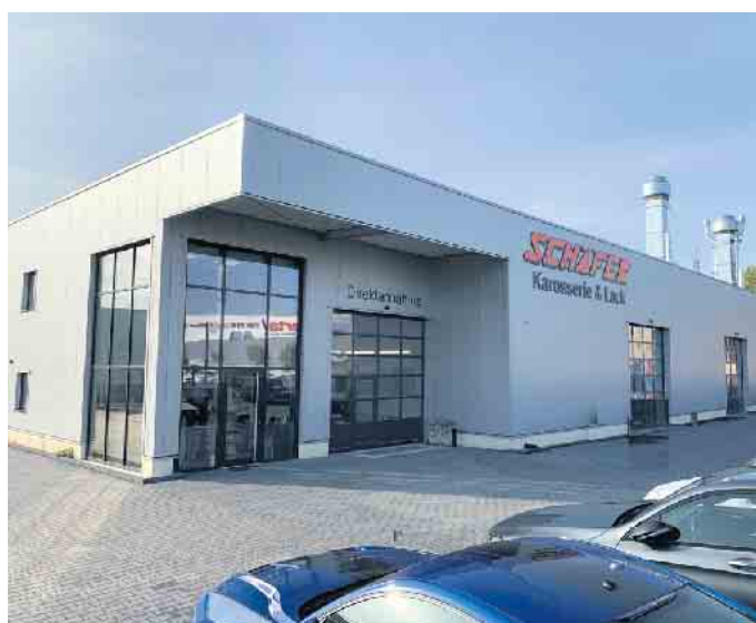
Attraktive Architektur, modernste Technik innen