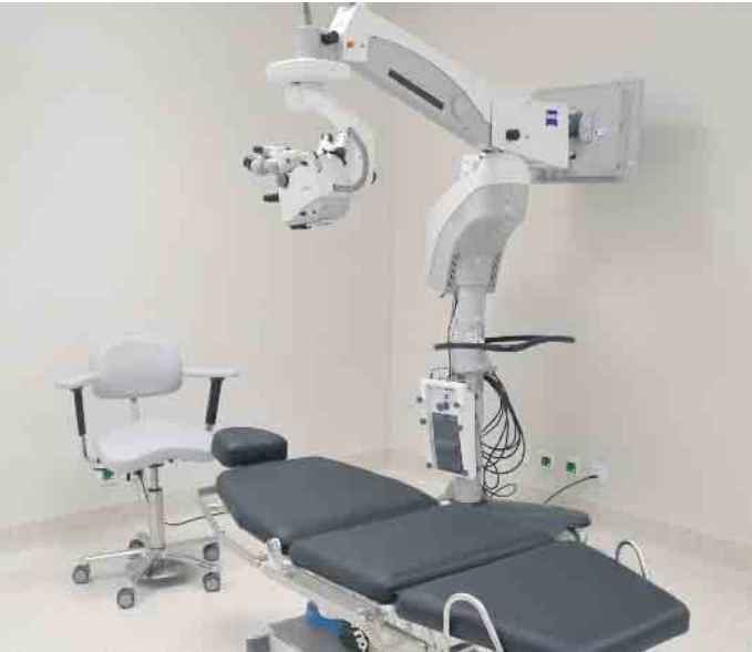
Im neuen OP-Bereich: Per Spritze mit feinsten Nadel in das Auge wird die Makuladegeneration behandelt.

Das „Augencentrum Köln“ hat sein neues Zentrum zur Behandlung von Makuladegenerationen eröffnet