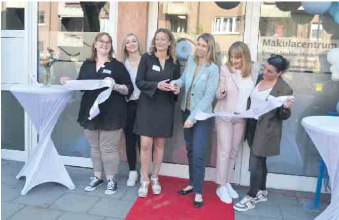
Der Betrieb läuft seit Anfang März: Jetzt wurde das „Makulacentrum“ offiziell eröffnet.