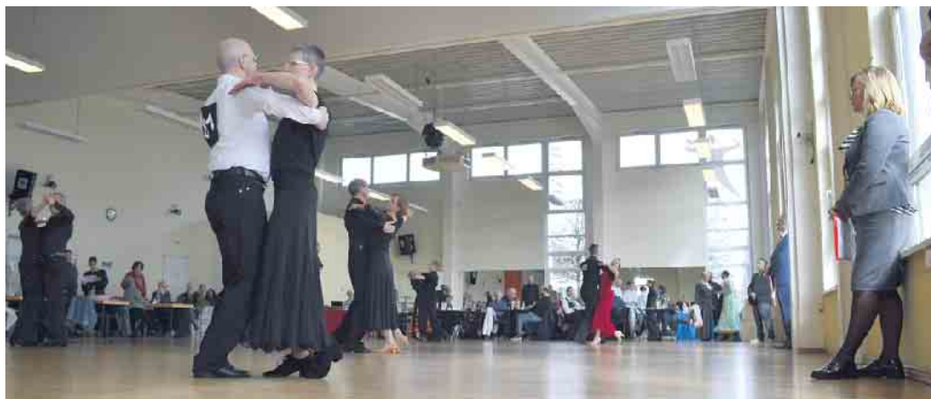
Paare aus Bayern, Niedersachsen, Berlin, Hessen oder auch Rheinland-Pfalz gingen an den Start.

Der TGC Rot-Weiß Porz hat seinen 49. Osterpokal ausgerichtet - und das in Kooperation mit einem anderen Verein aus dem Stadtbezirk Porz