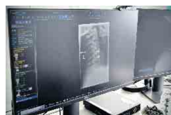
Der Blick auf einen Bandscheibenvorfall: die Porzer Mediziner*innen sind spezialisiert und zertifiziert für solche Krankheitsbilder.