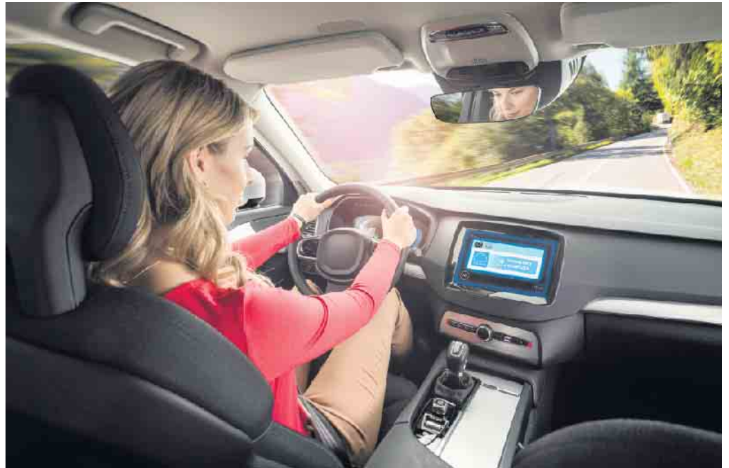
Moderne Software-Systeme und vielfältige Anwendungen machen aus dem Auto einen Computer auf vier Rädern.