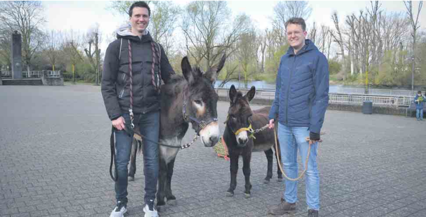
Text und Foto: Lars Göllnitz