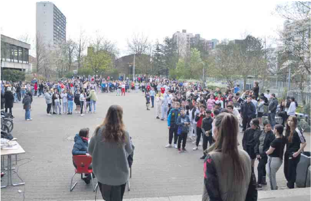
Die Klassen fünf, sechs und sieben warten auf den Start.

Das seit 1967 errichtete Finken- berg sollte ein Vorzeige-Viertel mit breiter Sozialstruktur werden.