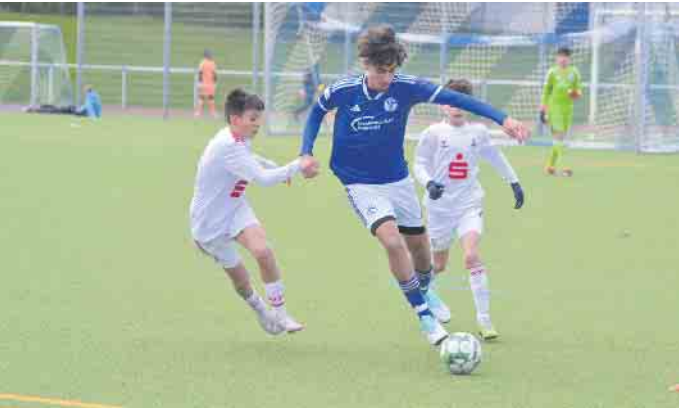
Der FC und Schalke trennten sich 3:2.

Der FC Germania Zündorf hat sein Jugendturnier ausgerichtet - die Ergebnisse