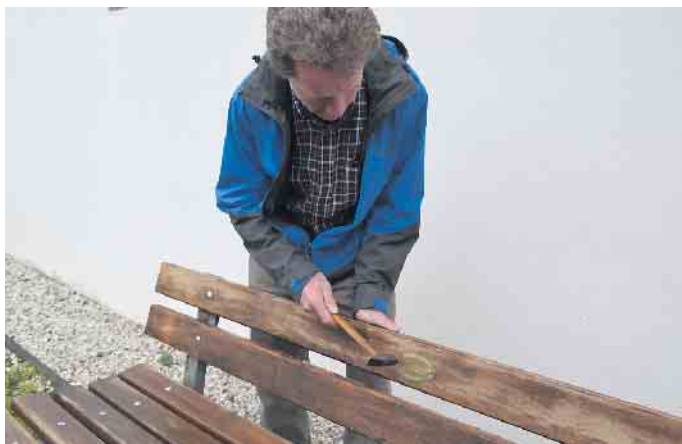
Eine Plakette zierte die von der Begräbnishilfe aufgestellte Bank.

Der Verein Begräbnishilfe unterstützt seit 100 Jahren Menschen bei der Finanzierung von Bestattungskosten