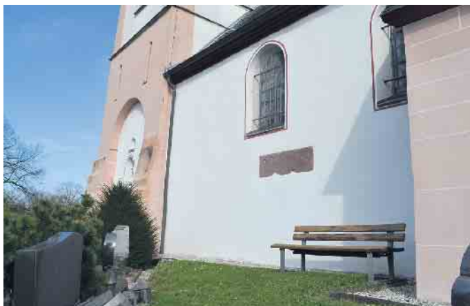
Windgeschützt und direkt an der Kirche St. Michael steht die Bank.