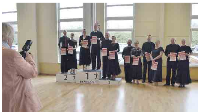
Das obligatorische Treppchenfoto: Hier in der Klasse Masters 1C Standard.