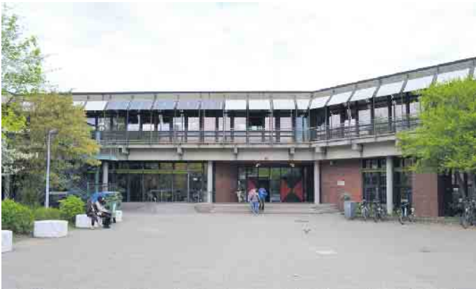
Die Lise-Meitner-Gesamtschule, benannt nach der österreichische Kernphysikerin Lise Meitner, wird dieses Jahr 50 Jahre alt.