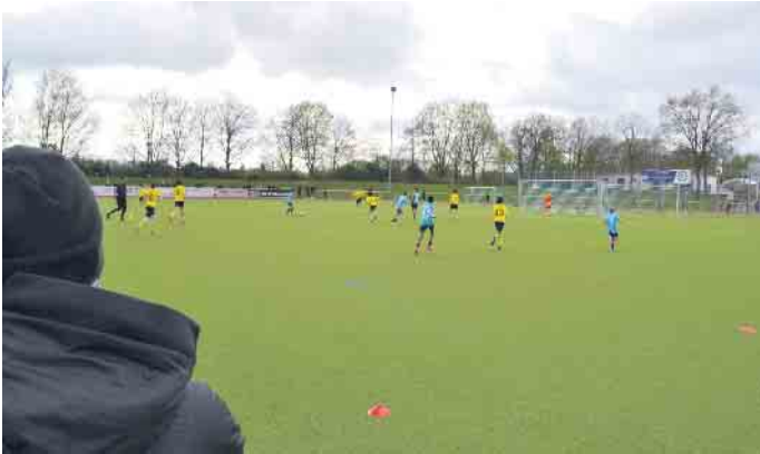
Auf zwei Plätzen wurde parallel gespielt - jede Partie dauerte 20 Minuten.

hat der Club die U13-Vertretungen namhafter Clubs nach Zündorf gelockt. Zudem reichlich Zuschauende. Die jungen Kickenden des FC Germania sind in ihrer Vorrundengruppe zwar letztlich Fünfte und Letzte geworden, haben sich aber insgesamt gut aus der Affäre