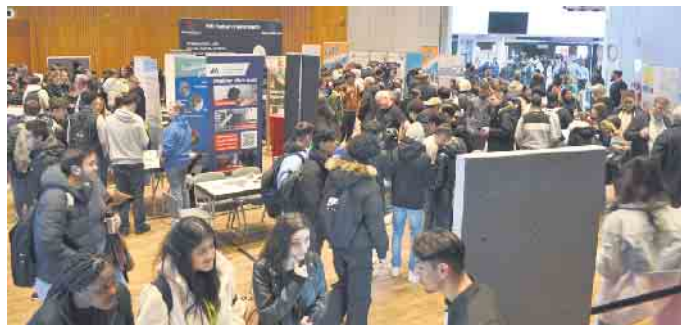
Auch 2024 war zum Berufsforum viel los im Bezirksrathaus.

sierten Besucher*innen der Börse vor - darunter vor allem Schüler*innen der rechtsrheinischen Schulen. Bei der Ausrichtung, der nach Schwarzers Angaben größten Ausbildungsbörse im rechtsrheinischen Köln kooperiert Eigenart wieder mit dem Porzer Bezirksamt um Leiter Guido Motter. Dieser rechnet mit rund 1.000 Schüler*innen, die über drei Stunden verteilt die Veranstaltung besuchen - vor allem aus dem Stadtbezirk Porz, aber auch etwa aus