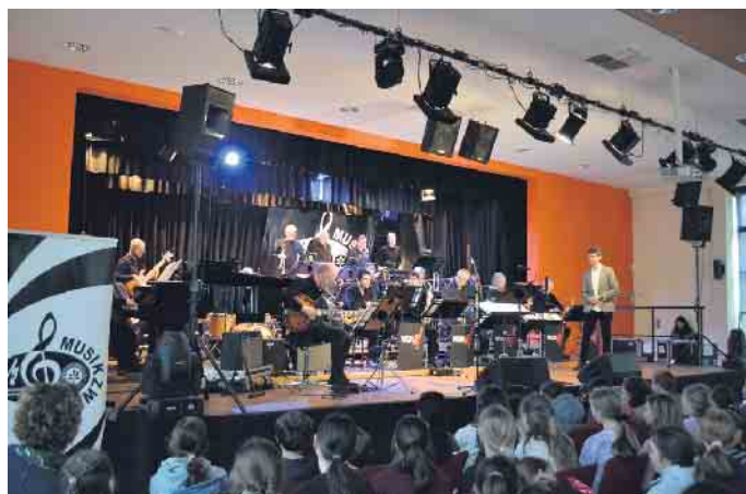
17 Musiker*innen auf der Bühne: Die WDR-Big Band beim Auftritt im Stadtgymnasium.

Das Porzer Stadtgymnasium ist für das Projekt „jazz@school“ der WDR-Big Band ausgewählt worden - reichlich Einblicke und Musik gab es inklusive