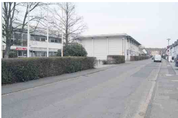
Auch das Thema mögliche Schulstraßen an Grundschulen beschäftigte die BV - hier ein Foto der Wahner Grundschule.

Uneins zeigte sich die BV beim Thema Autokino Eil. Demnach soll das Areal Autokino aus dem Grundstück zwischen Rudolf-Diesel-Straße, Theodor-Heuss-Straße,