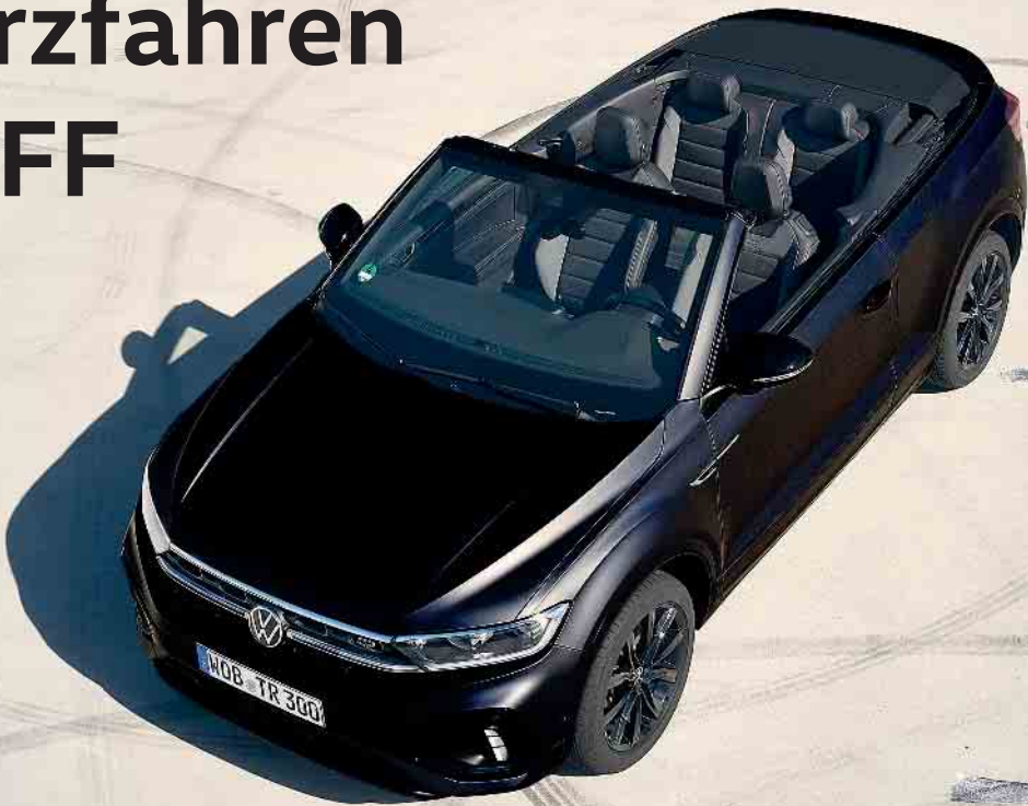
T-Roc Cabriolet R-Line Edition Black. Jetzt privat leasen ab 299,00 € 1,2,3

Kraftstoffverbrauch in l/100 km: 6,7 kombiniert, 8,4 innerstädtisch (langsam), 6,5 Stadtrand (mittel), 5,8 Landstraße (schnell), 6,9 Autobahn (sehr schnell), CO 2 -Emission in g/km: 150 (kombiniert), CO 2 Klasse: E