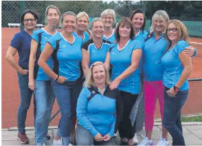
Die Damen 40 sind in die zweite Bezirksliga aufgestiegen.

Zudem hat der Club von Mai bis Oktober die jährlichen Clubmeisterschaften für Erwachsene und Jugendliche ausgetragen. Im September führten die Jugend-