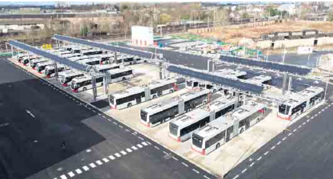
In etwa so groß wie neun Fußballfelder ist der neue Betriebshof nach kompletter Fertigstellung.

Die KVB haben den ersten Teil ihres neuen Bushofs an der Kaiserstraße eröffnet - und übt Kritik an wohl auslaufender Förderung des Bundes