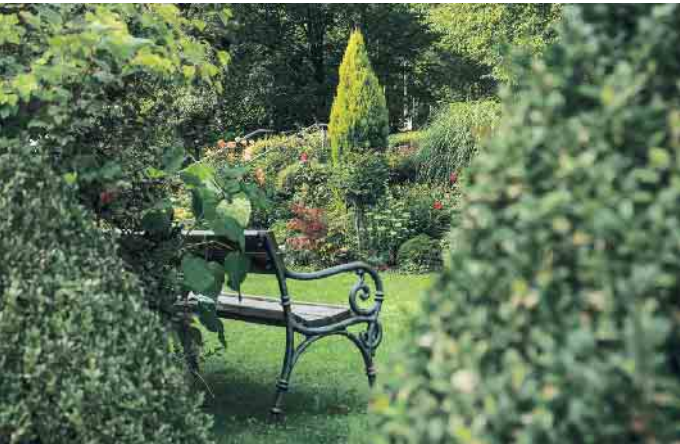
Rasengrab oder Bestattung im Blumengarten.