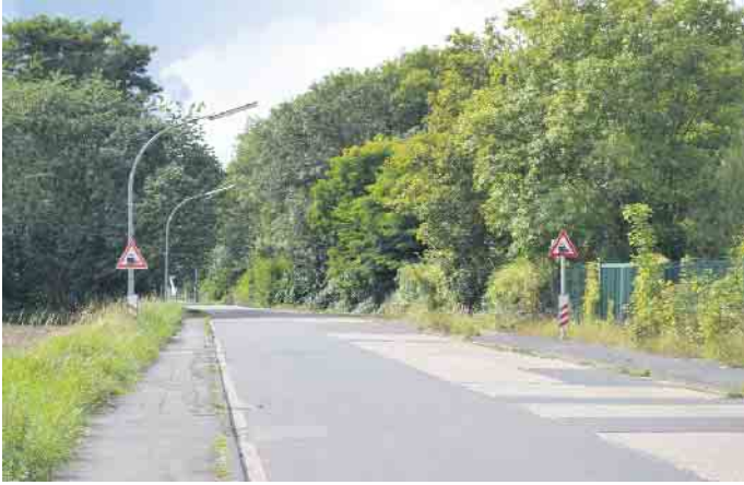
Für die Porzer Ringstraße soll nach Wunsch der BV ein Verkehrssicherheits-Konzept erstellt werden.

Stadtbezirk Porz - Gleich zu Beginn ihrer Januar-Sitzung standen einige Straßennamen auf der Agenda der Porzer Bezirksvertretung (BV). So soll per einstimmigem Beschluss ein möglicher neuer Name für die Ferdinand-Porsche-Straße in Eil gefunden werden. Demnach solle die Verwaltung eine lokale Befragung Anwohner durchführen - mit drei Optionen als Ergebnis: Die Beibehaltung des bisherigen Straßennamens, die Beibehaltung des bisherigen Straßennamens bei gleichzeitiger Errichtung einer Informationstafel oder die Umbenennung der Straße.