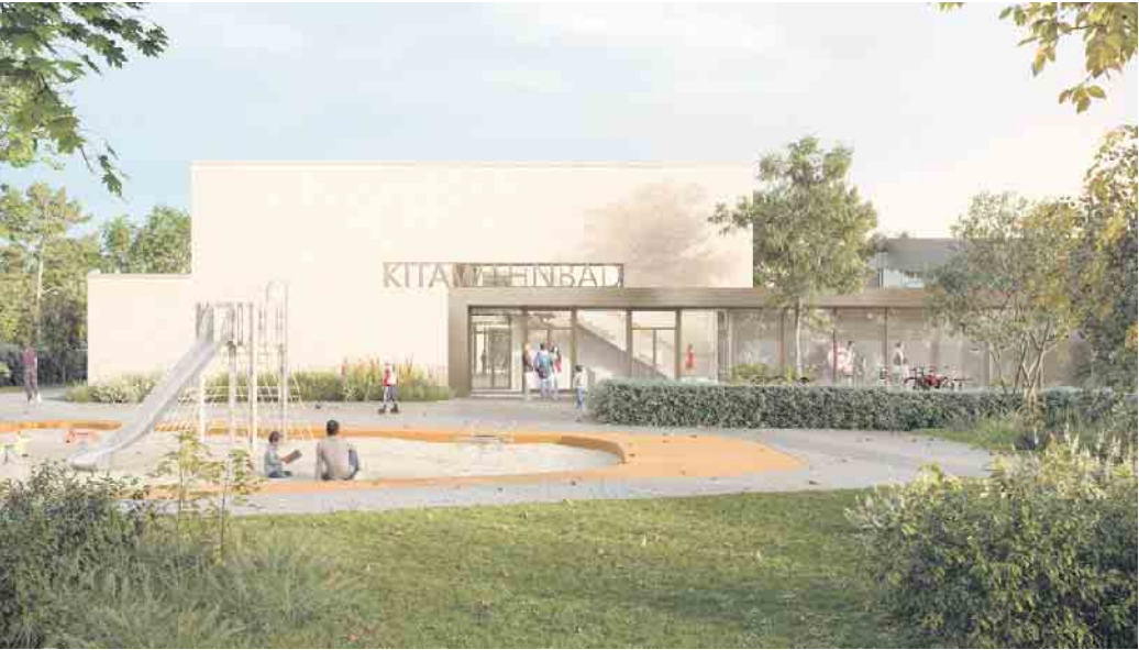
So könnte das Gebäude nahe des Wahner Schwimmbads ausschauen. Foto: ZHAC Zweering und Helmus Architektur + Consulting

Akteure von KölnBäder GmbH, dem AWO Kreisverband und der Wohnungsgesellschaft der Stadtwerke Köln haben die Absichtserklärung für den Bau einer Schwimm-Kita unterzeichnet