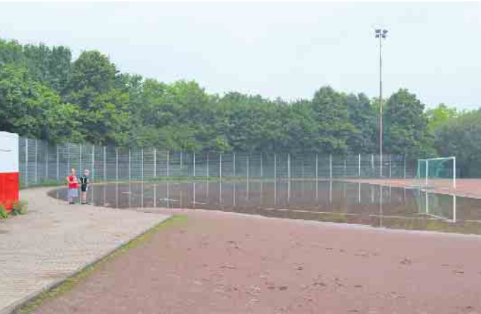
Bei Regen steht der Platz oft unter Wasser: Die BV fordert die Stadt auf, Gelder für die Sanierung des Sportplatzes an der Stresemannstraße bereitzustellen.

Beschlüsse der Bezirksvertretung - Themen, über die die Porzer Lokalpolitik bei ihrer Januar-Sitzung gesprochen hat