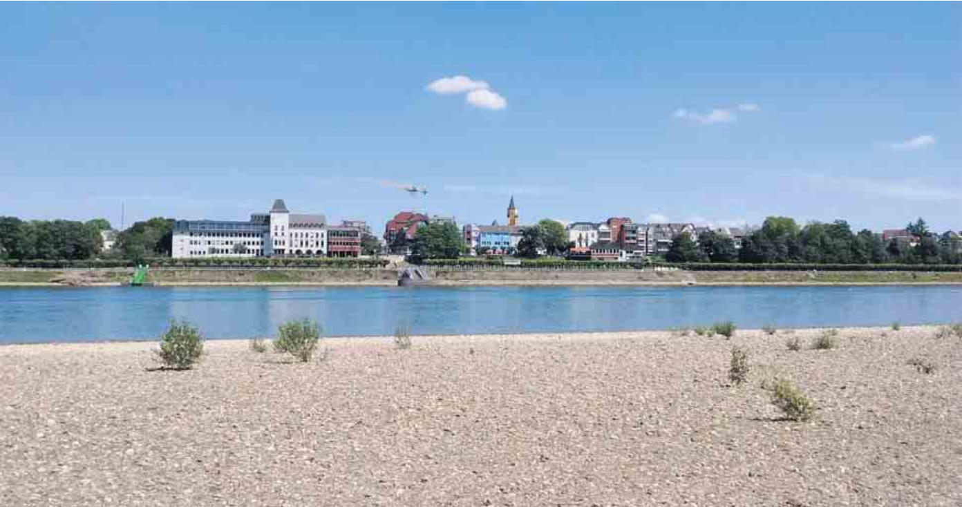
Text und Foto: Lars Göllnitz