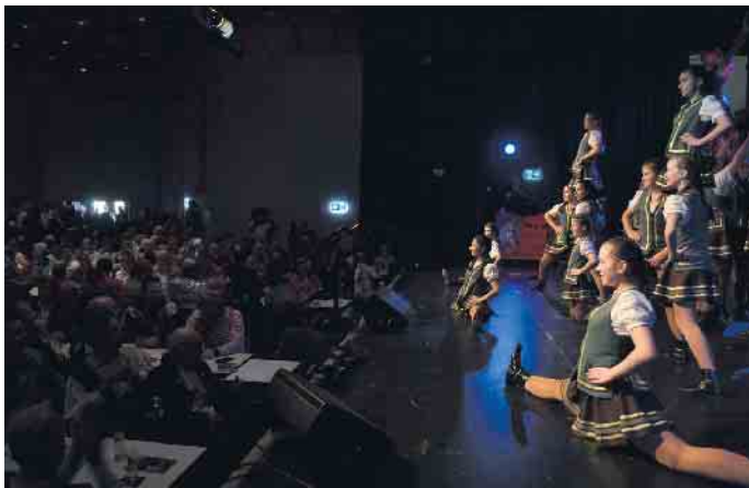
Urbacher Räuber, Poorzer Nubbele und Fidele Aujusse haben im Rathaussaal ihre gemeinsame Herrenparty gefeiert.

Stadtbezirk Porz - Für die vielen jungen Tanzgruppen der Porzer Karnevalsgesellschaften ist die Veranstaltung ein fester Termin im Sessions-Kalender. Der „Pänz Dance“ im Rathaussaal im Bezirksrathaus am 9. Februar . Mit der Veranstaltung bietet der Festausschuss Porzer Karneval den Gruppen eine große Bühne. Geleitet und vor allem getanzt vor den Augen vieler Eltern wird ab 12 Uhr. Ebenfalls auf der Bühne: das Kinderdreigestirn mitsamt Fünkchen der Kinderprinzengarde und die Band „Brass Gass“. Der Eintritt ist frei. Die KG Närrischer Laurentius richtet am selben Tag eine Kölsche Messe in der Kirche St. Laurentius aus. Los geht es bereits ab 11:45 Uhr. Das Besondere: Seit Jahren pflanzt im Anschluss an die Messe das amtierende Dreigestirn einen Baum auf einem Grundstück direkt an der Ensener Kirche St. Laurentius.