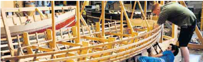
Die Faszination der Tätigkeit eines Bootsbauers liegt vor allem in der Vielfalt der Anforderungen. Gefragt sind nicht nur handwerkliches Geschick und technisches Know-how, sondern vor allem auch Kreativität.

Umschulung zum Bootsbauer: Wo Kreativität und technisches Geschick gefragt sind