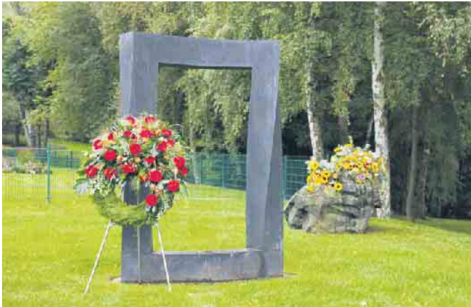
Tor zwischen den Welten.

Früher waren Krankheit, Sterben und Tod in der Großfamilie unter einem Dach vereint, genauso wie Romanze, Heirat und Geburt. Heute haben viele Menschen nie lernen und auch nie erfahren können, was Sterben und Tod bedeuten und wie sie von einem geliebten Menschen Abschied nehmen und richtig trauern können. Hinzu kommt, dass viele Angehörige nicht mehr an einem einzigen Ort leben und kaum einen Bezug zum örtlichen Friedhof haben. Mit der Trauer kommt die schmerzliche Erkenntnis der Endlichkeit. Die Einsicht reift, dass ein Partner, Freund oder Verwandter nach einem Todesfall tatsächlich nicht mehr da ist. Viele Bereiche des täglichen Lebens werden nicht mehr so sein wie bisher. Diese Einsicht ist oft so schmerzhaft, dass Menschen manchmal meinen, im Trauerfall besonders stark sein zu müssen, oder versuchen, sich anders abzulenken. Dabei ist es wichtig, die Trauer und damit auch den Schmerz zuzulassen, um den persönlichen Weg der Trauerbewältigung besser finden können.