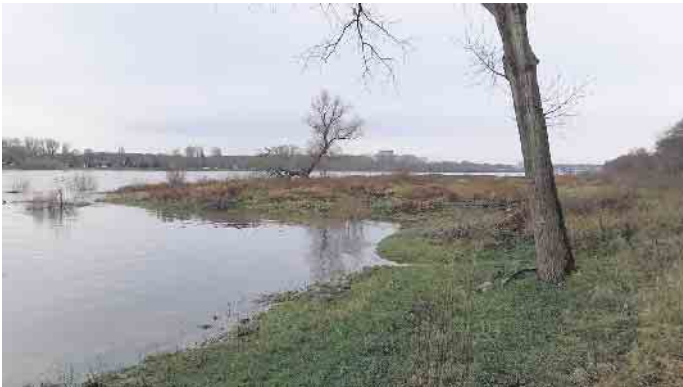
Direkt am Rhein, am ehemaligen Lagerplatz in Ensen wächst der Baum.

Ensen - Viele Jahrzehnte stand er als ehemals kleiner unbeachteter Busch am Rande des Lagerplatzes in Ensen. Nun hat der Baum am Rhein-Ufer eine beachtliche Größe erreicht. Für Jörg Pfennig, ortshistorisch interessiert und aktiv im Archiv der Bürgervereinigung Ensen-Westhoven, ist er ein Wahrzeichen.