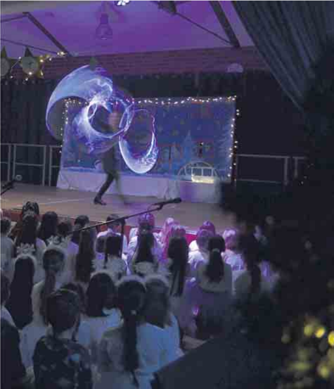
Text und Fotos: Lars Göllnitz

Die Grundschule Kupfergasse in Urbach und ihr offener Ganztags haben ihr Lichterfest in diesem Jahr statt vor, erst nach Weihnachten gefeiert.