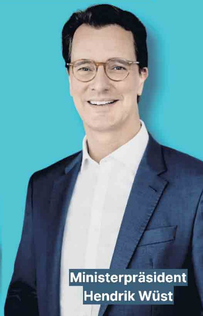
Ministerpräsident Hendrik Wüst

Wir laden Sie herzlich ein zu einem besonderen Abend mit unserem Landesvorsitzenden, Ministerpräsident Hendrik Wüst MdL.