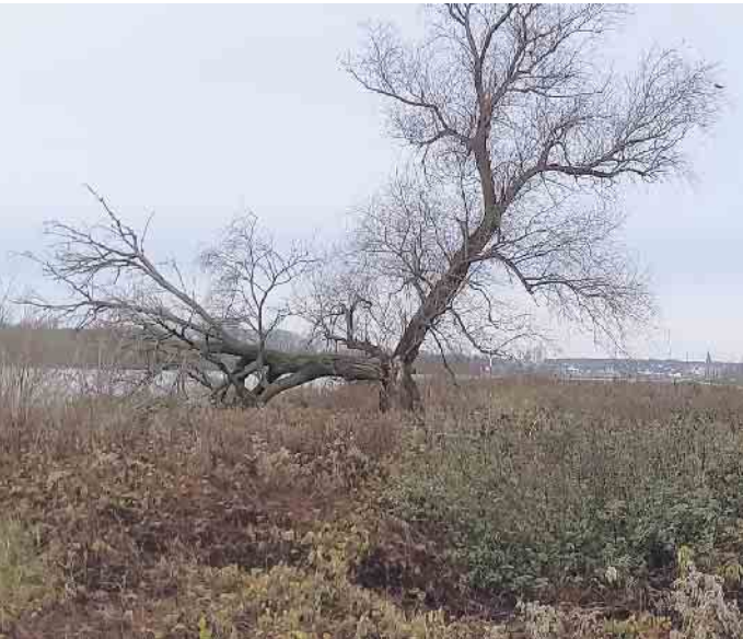
Der Baum hat inzwischen einen seiner Stämme verloren.