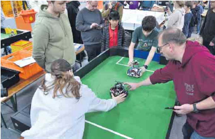
igus richtete erneut eine Vorrunde des RoboCup Junior aus.

der Roboter-Szene. Angereist von Schulen und Hochschulen. RoboCup Junior heißt die Veranstaltung, die nun zum zweiten Mal mit einer Vorrunde bei igus stattfindet. Für die jungen angehenden Roboter-Expert*innen hat das gleich mehrere Vorteile: Man stelle den Ort kostenfrei zur Verfügung. Die Ausrichter hätten oft Probleme passende Locations