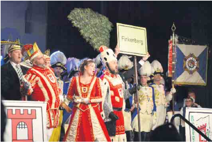
Für das Sessionslied gibt es nicht nur einen neuen Text, sondern auch passende Veedels-Schilder.

Das Porzer Dreigestirn ist offiziell proklamiert worden - für die Session hat das Trifolium ein Lied vorbereitet