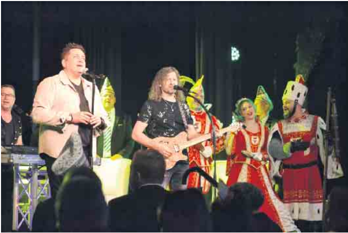
Zusammen mit der Band Domstürmer ist das Lied mit neuem Text entstanden.