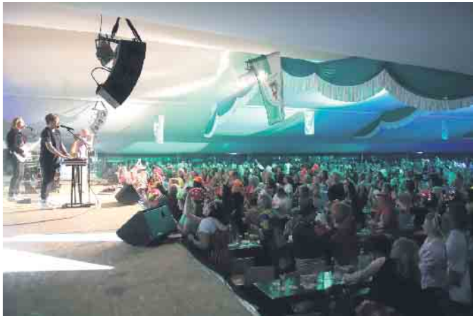
Im Festzelt der Rezag sitzt beim Auftritt von Cat Ballou niemand mehr am Tisch.

se Funke Wahn (BWF) im Eltzhof und bei der Rezag im Festzelt an der Poststraße bei den ersten Porzer Karnevalstönen dieser Session gefeiert haben. Genauso bunt war das Programm bei bei-