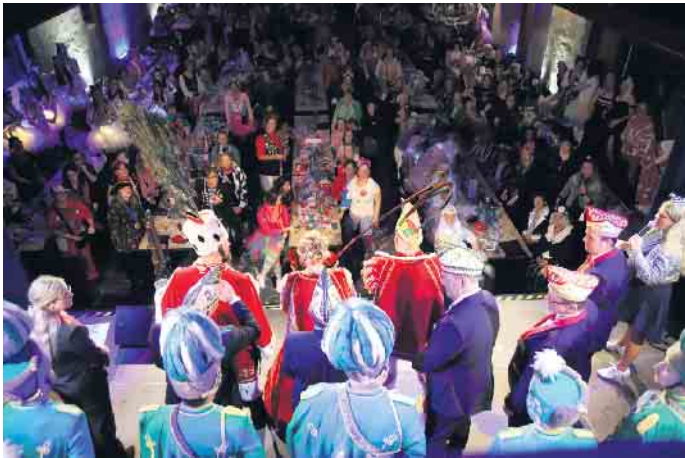
Zahlreiche Karnevalist*innen feiern im Eltzhof den Beginn der Session mit dem Porzer Dreigestirn.