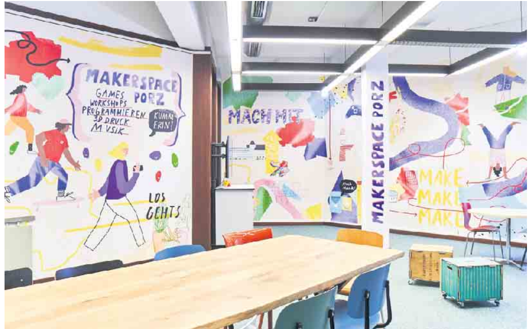
Ein bunter, kreativer Ort ist der Makerspace auf der ersten Etage der Bücherei.

Passend zur Feier hat die Bibliothek ein neues Gerät angeschafft: Mit einem Lasercutter zur Benut-