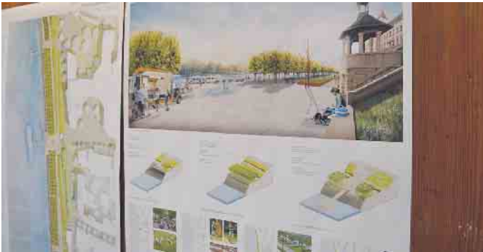
Das Rhein-Ufer in Porz-Mitte soll neu gestaltet werden - Baubeginn könnte in 2026 sein.

aus Theater und Kabarett statt. Zudem etwa am 28. Januar die nachmittägliche und beliebte Karnevalssitzung für Senior*innen. Ein paar Kilometer weiter südöstlich im Wahner Eltzhof beginnt das Comedy- und Kabarettprogramm am 22. Januar mit einem Auftritt der A capella-Gruppe Maybebop. Am 29. Januar folgt der Abschlussabend des aktuellen Comedyprogramms von Jan van Weyde. Das generelle Programm im Eltzhof startet am 10. Januar mit dem Wierverklaaf der Karnevalsgesellschaft Blau-Wiesse-Funke Wahn. Im Bürgerzentrum Engelsdorf beginnt das Programm am 9. Januar mit einem Auftritt von Kabarettistin Eva Eiselt. Am 18. Januar folgt ein Karnevalströdelmarkt. Der Verein Porzer Handwerksmeister begeht indes bereits am Sonn-