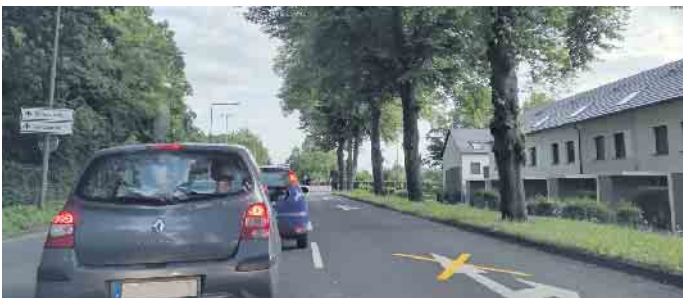
Die Steinstraße soll ab Ende Januar wieder in beide Richtungen befahrbar sein.