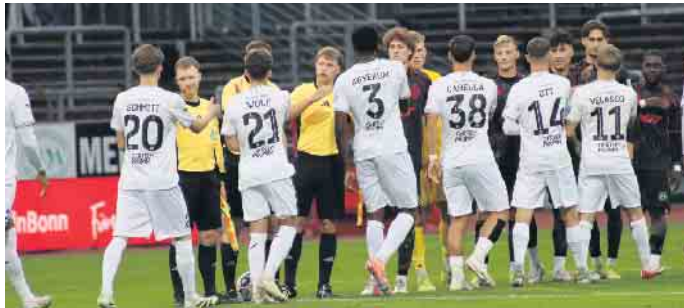
Unter anderem spielte Viktoria Köln gegen den SC Fortuna Köln.

1. FC Köln, Viktoria Köln und der SC Fortuna Köln erspielten beim „Cologne Cup“ Gelder für Kölner Amateurvereine - darunter auch drei aus dem Stadtbezirk Porz