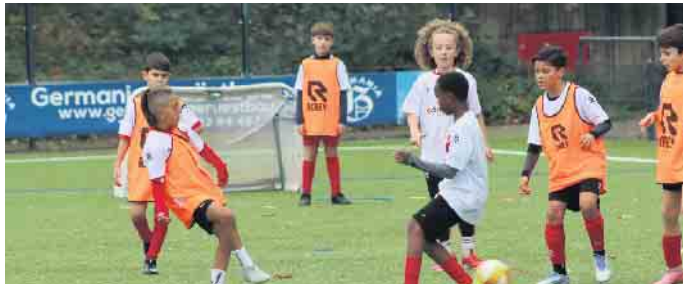
Insgesamt 100 Kinder trainierten beim Jugendtrainingstag im Vorfeld des Cologne Cups am Kölner Südstadion.