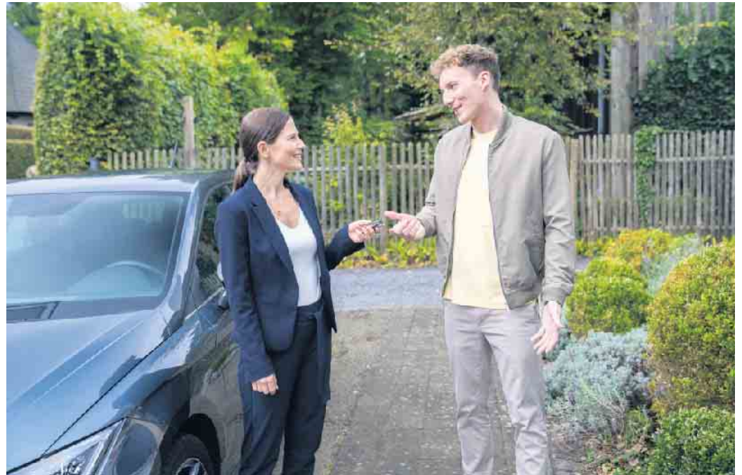
Beim Autokauf ist für mehr als Dreiviertel der Deutschen der Preis das wichtigste Kriterium.

Schon heute sind Pkw mit Elektromotor bei den laufenden Kosten attraktiver als Verbrenner. So