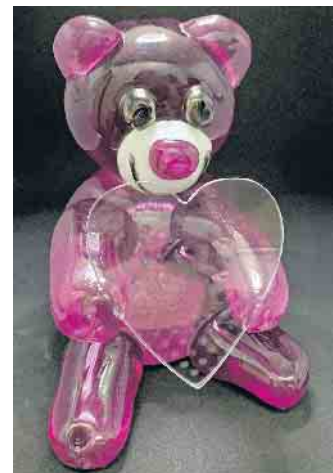
Ein individuelles Erinnerungsstück: Die Bärchenskulptur erinnert auf liebevolle Weise an einen geliebten Menschen.

Was eine moderne Gesellschaft am meisten prägt, dürfte ihr permanenter Wandel sein. Bei den Lebensumständen ist erlaubt, was gefällt - und womit man anderen Menschen nicht in die Quere kommt. In Bewegung geraten sind alle Lebensbereiche, dazu zählt auch die Bestattungskultur. Die klassische Sargbestattung ist zur Ausnahme geworden, es dominiert inzwischen die Urnenbeisetzung, entweder auf dem Friedhof oder zunehmend im Wald. Noch nicht so bekannt, aber immer beliebter sind persönliche Erinnerungsobjekte. Die sogenannte Kristallbestattung beispielsweise bietet den Hinterbliebenen eine Möglichkeit, Kristallkunstwerke als Erinnerungsstücke in der Hand halten, sie um den Hals tragen oder sie als Skulptur auf ein Fensterbrett im Wohnzimmer stellen zu können. Über die haptische Erfahrung ist das Gedenken an die verstorbene Person stets präsent. Wie muss man sich eine sogenannte Kristallbestattung vorstellen?