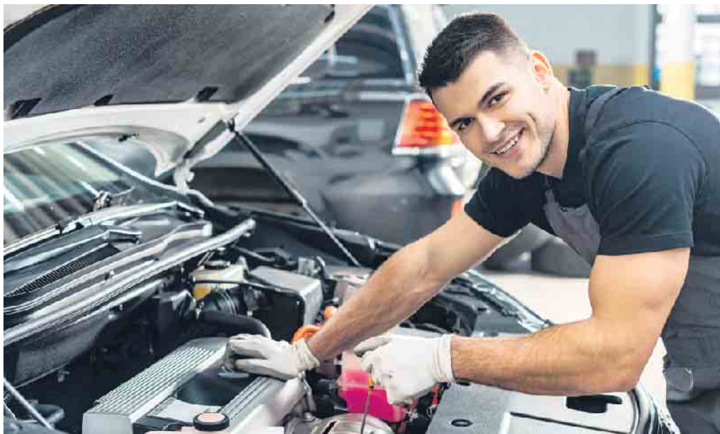
Muss ein Auto in die Reparatur, drohen hohe Kosten und - schlimmstenfalls - Ärger mit der Werkstatt.

Es ist ratsam, vertraglich festzulegen, wie lange die Reparatur dauert.