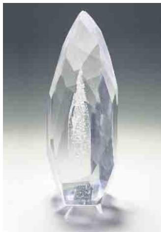
Aufgrund seiner Größe und seines Gewichts ist dieser Erinnerungskristall für zu Hause gedacht. Eine individuelle Struktur mit Ecken und Kanten - genau wie die Person, an die gedacht wird.