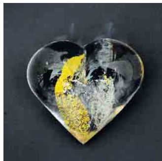
ewiger Liebe entworfen.

Erinnerung für zu Hause: Kristallbestattungen als neue Form des Totengedenkens