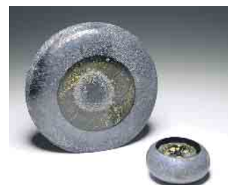
Der Erinnerungskristall „Sonne“ ist ummantelt von natürlichen Metallen und verfeinert mit Goldanteilen. Die polierte Standfläche lässt sich optional gravieren.

oder Skulpturen verbleibende Asche kann an das Bestattungsinstitut in Deutschland zurückgesandt werden, um eine Urnenbeisetzung im Heimatort auszurichten. Optional gibt es aber auch die Möglichkeit, die Asche ohne Urne in der freien Natur auf einem Waldfriedhof beisetzen zu lassen. Dieser befindet sich in einem ruhigen Waldstück im Schweizerischen Poschiavo, inmitten der Schweizer Alpen im Kanton Graubünden. (djd)