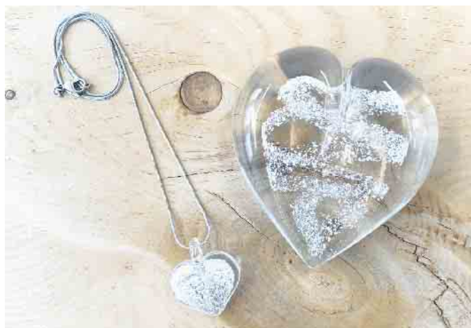
Mit dem Set aus Herzkette und Handschmeichler begleiten die Lebensspuren eines geliebten Menschen die Angehörigen auf allen Wegen.