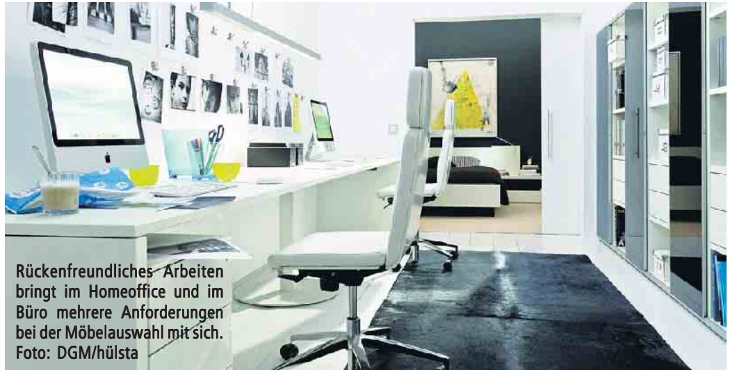
Rückenfreundliches Arbeiten bringt im Homeoffice und im Büro mehrere Anforderungen bei der Möbelauswahl mit sich.

Zur Standardausstattung der meisten Büro-Arbeitsplätze zählt der höhenverstellbare Schreibtischstuhl. Aber auch höhenverstellbare Schreibtische sind verstärkt im Kommen und besonders ergonomisch, denn Arbeiten im Stehen ist noch rückenfreundlicher als im optimierten Sitzen. Die optimale Sitzposition ist erreicht, wenn die Knie 90 Grad oder etwas mehr abgewinkelt sind, während die Füße gerade auf dem Boden stehen. Der Winkel zwischen Oberkörper und Oberschenkel sollte dabei mehr als 90 Grad betragen. Eine bewegliche Rückenlehne und Sitzfläche kommen der idealen Sitzposition