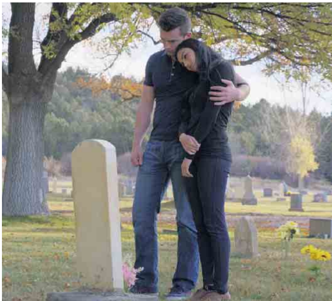
Bestattung: Rechtzeitig vorsorgen, um Zeit fürs Trauern zu haben.

Die Kosten für unterschiedliche Bestattungsarten wie Urnen- oder Erdgrab variieren stark. Zudem gibt es erhebliche Qualitäts- und dementsprechende Preisunterschiede bei Bestattungsleistungen. Angefangen mit dem Blumenschmuck über die Ausstattung des Sargs bis hin zur Art des Grabsteins. Zudem fallen viele Kosten an, mit denen man im ersten Moment gar nicht rechnet: beispielsweise Porto für Trauerbriefe, Traueranzeigen, die Aufbewahrung des Leichnams in einer Kühlzelle, das Totenkleid oder Friedhofs- und Verwaltungskosten. (ots)