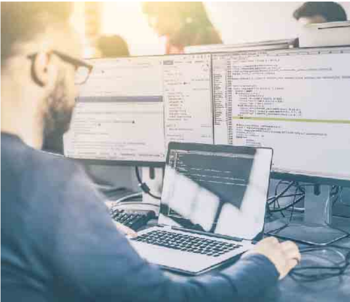
Cybercrime-Experten setzen sich vor allem mit dem technischen Vorgehen von Hackern auseinander.

oder dem Lahmlegen von Rechnernetzen. Zusätzlich stehen kriminaltechnische, juristische und auch moralische Inhalte auf dem Lehrplan. (djd)