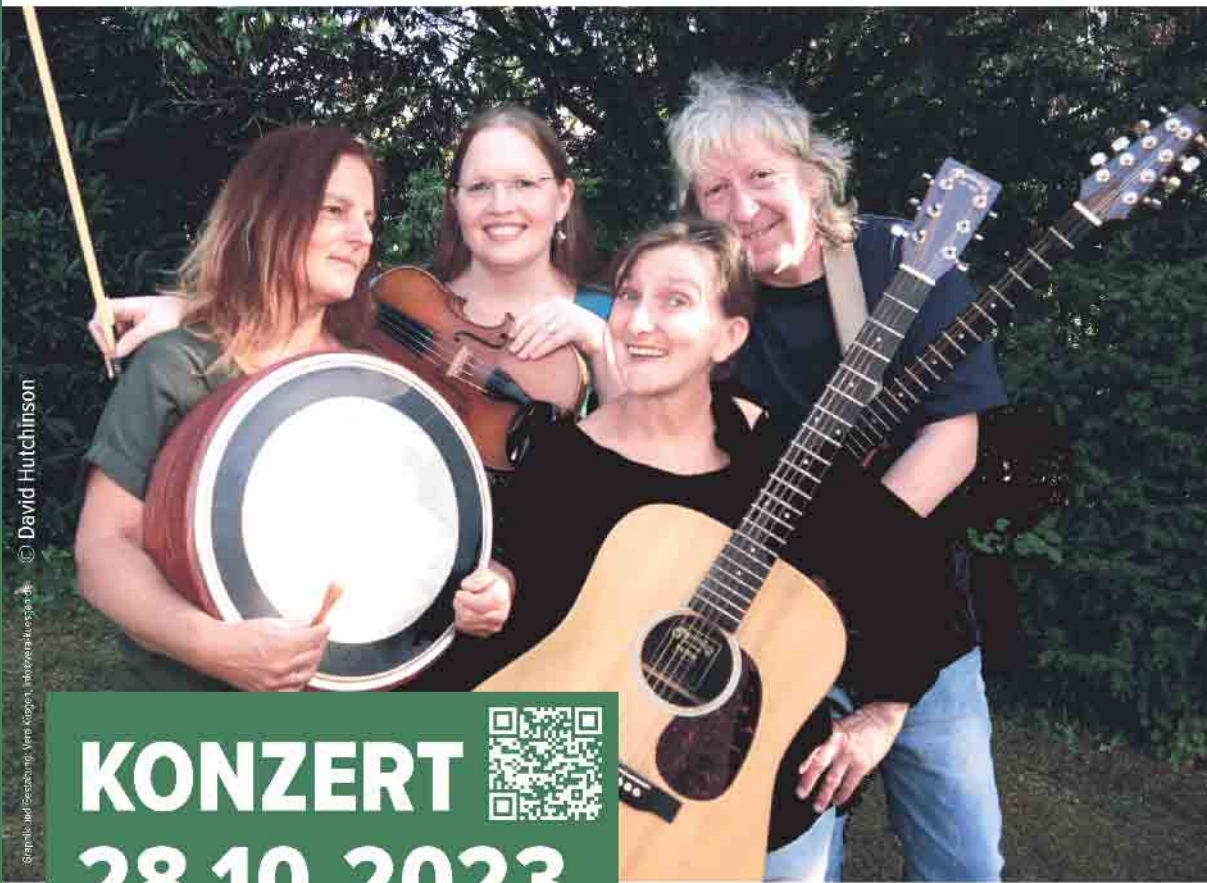
© David Hutchinson © Grafik und Gestaltung: Vera Kögler, Infoversales.de