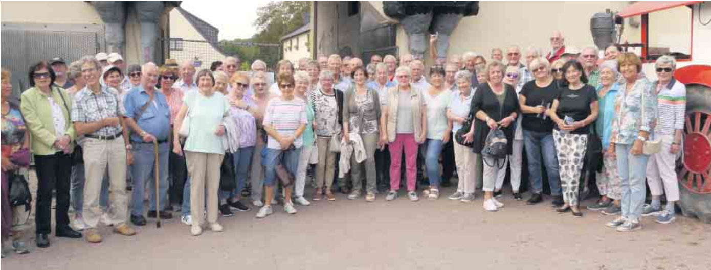
Am Eingang der Straußenfarm haben sich die Overather Wanderer versammelt