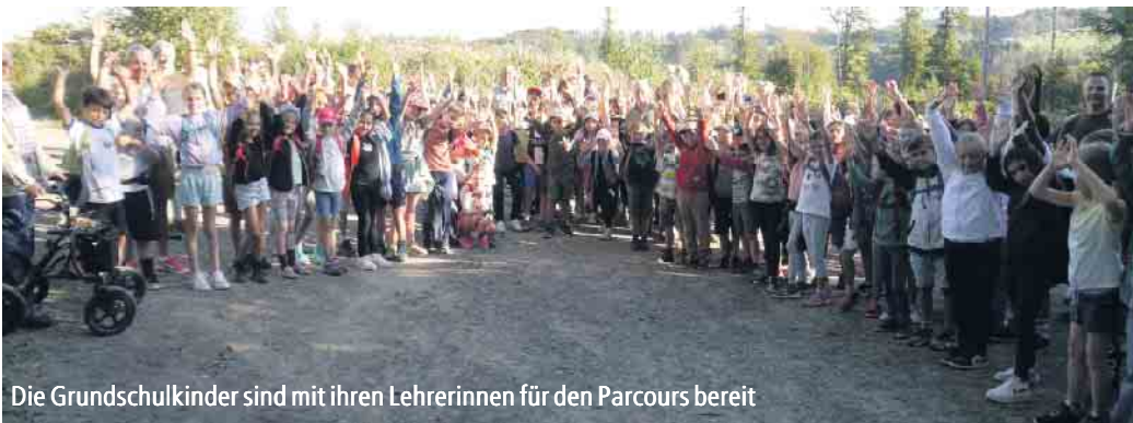
Die Grundschulkinder sind mit ihren Lehrerinnen für den Parcours bereit