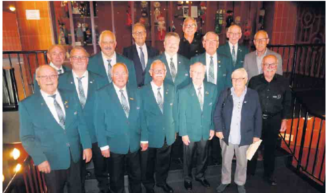
Die Overather Jubilare fühlen sich auf der Treppe des Bergischen Löwen recht wohl