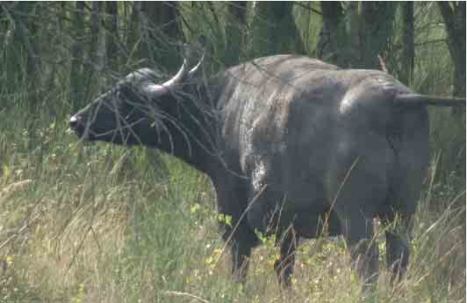
Wasserbüffel in der Heide

zu vermeiden. Mittlerweile erfüllen sie ihren Zweck voll und ganz. Die Tour führte uns als erstes zur alten Tongrube. Der Abbau und die Verwertung des tertiären Tons haben in der Wahner Heide eine lange Geschichte. Zeugnis davon geben die Spuren der Altenrather Töpfer des 17. Jahrhunderts und