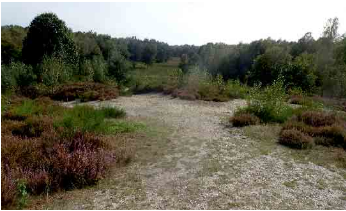
Blick in die Heide

die Tonfabrik Ludwigshütte. Bereits seit 1930 ist das Gebiet allerdings unter Naturschutz. Insofern war der von 1968 bis 1982 teils großflächige Abbau von Ton in dieser Zeit illegal. Nachdem der Abbau aufgrund zahlreicher Proteste eingestellt wurde, diente die Grube noch einige Zeit als Schuttablade und der Teich wurde zum Baden benutzt.