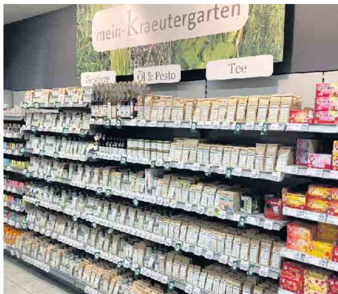
Das große Regal steht im Rewe Melanie Koch in Adenau.

Schauen Sie einfach einmal rein, entweder im Kräuterladen (Do.-Sa. 9-13 Uhr & Do.+Fr. 14:30 - 18:30 Uhr) oder in den online-shop: www.mein-kraeutergarten.de