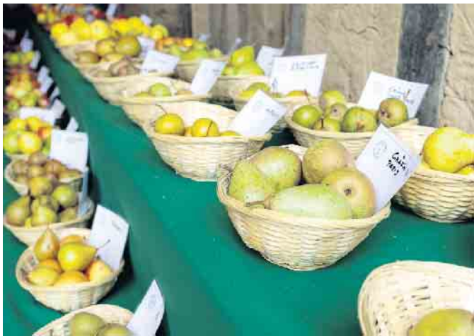
Birnensortenschau beim Obstwiesenfest beim LVR-Freilichtmuseum Lindlar.

„Obstwiesenfest“ im LVR-Freilichtmuseum Lindlar Sonntag, 1. Oktober 2023, 10 bis 18 Uhr Information: 02234 9921-555, www.freilichtmuseum-lindlar.lvr.de