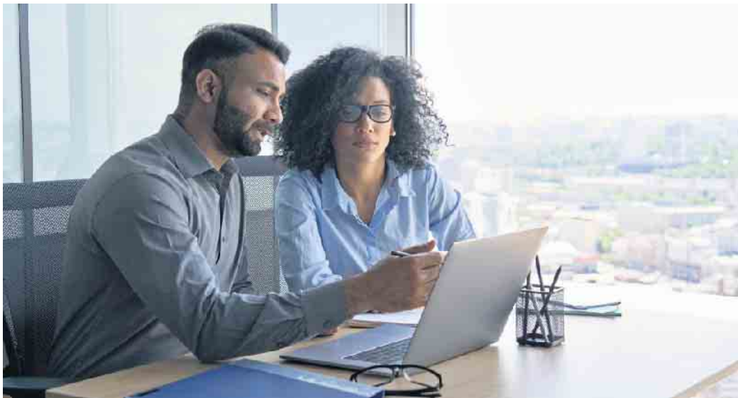
Mit praxisorientiertem Wissen bereiten die Kurse auf die Anforderungen der IT-Welt vor.

Schon während der Qualifizierung ist es sinnvoll, die nächsten Kar-