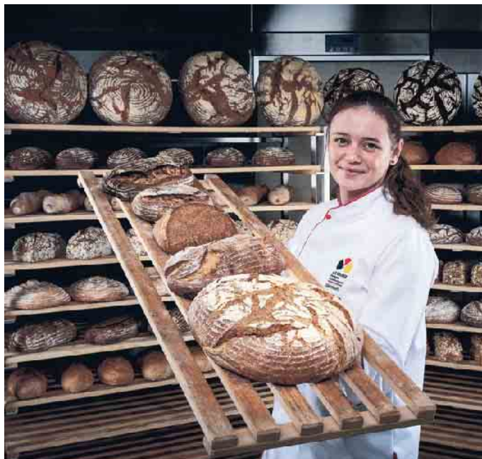
Junge Leute sind begehrt in der Branche - sie haben Spaß an Lebensmitteln, sind kreativ und holen sich ihre Inspirationen auch über soziale Medien.

Der Stellenfinder gibt einen Überblick über freie Stellen, Ausbildungs- und Praktikumsplätze: www.back-dir-deine-zukunft.de/stellenfinder (akz-o)