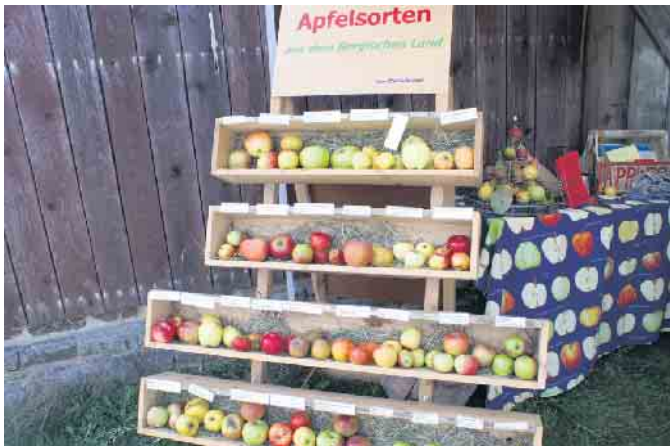
Apfelsortenschau beim Obstwiesenfest im LVR-Freilichtmuseum Lindlar.