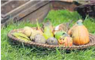
Der Bauernmarkt in Lindlar lohnte einen Besuch

Ende August fand der große Bauernmarkt mit weit über 100 Ausstellern auf dem Gelände des LVR-Freilichtmuseums in Lindlar statt.