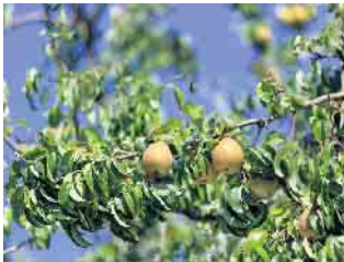
Apfelsorte Gräfin von Paris auf den Obstwiesen im Museums-gelände.

von Pizza aus dem Steinbackofen und Spanferkel vom Spieß bis hin zu gebackenen Champignons reicht. Am historischen Kiosk aus Wermelskirchen werden neben