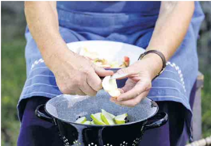
Vorbereitung zum Obstdörren beim Obstwiesenfest im LVR-Freilichtmuseum Lindlar.

Am Sonntag, den 1. Oktober 2023 findet im LVR-Freilichtmuseum Lindlar wieder das Obstwiesenfest statt. Zwischen 10 und 18 Uhr können hier verschiedene Obstsorten bestaunt werden, die heutzutage kaum mehr in den Supermärkten zu finden sind. Neben der großen Obstsortenschau gibt es auch wieder die professionelle Apfelsortenbestimmung. Wenn Unklarheit über die Sorte im eigenen Garten besteht, kann das Obst mitgebracht werden - für die genaue Sortenbestimmung sind drei bis vier Äpfel nötig. Wer hier etwas Neues ausprobieren möchte, kann auch direkt einen Obstbaum aus der Baumschule mit nach Hause nehmen. Natürlich steht auch saisonales Obst und Gemüse zum Verkauf, ebenso wie De-