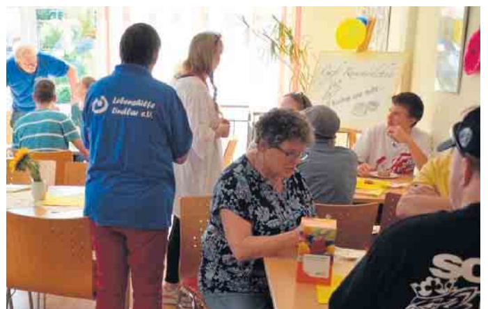
Angeregte Gespräche im Café Kommödchen