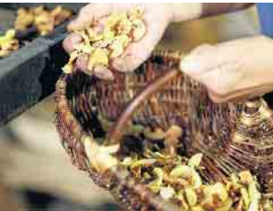
Getrocknete Äpfel frisch aus dem Dörröfen beim Obstwiesenfest im LVR-Freilichtmuseum Lindlar.

Obstwiesenfest im LVR-Freilichtmuseum Lindlar