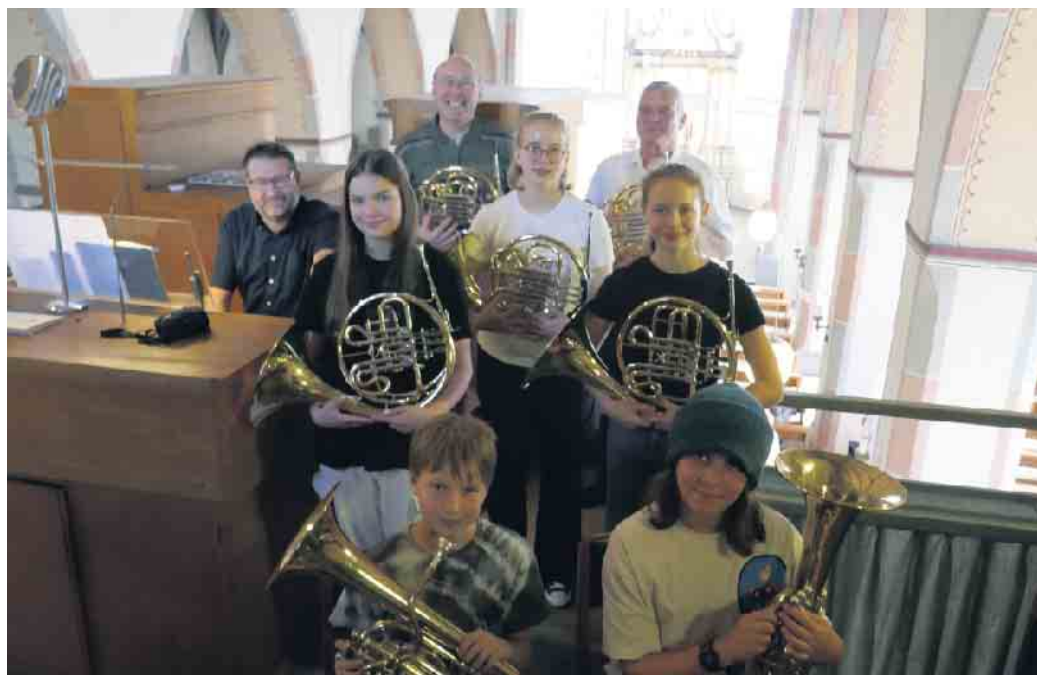
Das Horn- und Euphoniumensemble des Vereins Musiklehrer Overath

Die hohe Qualität des Vortrags war auch darin begründet, dass sämtliche jugendlichen Mitglieder des Ensembles inzwischen Preisträger des Wettbewerbs „Jugend musiziert“ sind. In diesem