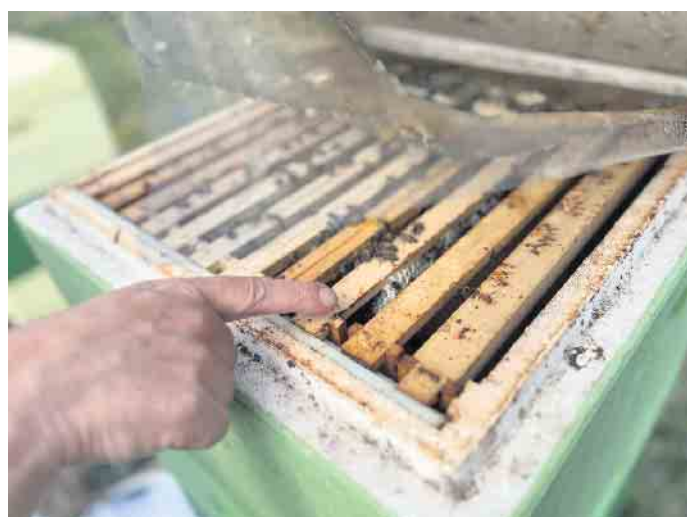
So fleißig sind die Werksbienen.

KOLL Steine Ideengarten Maarstr. 85, 53227 Bonn-Beuel CSH