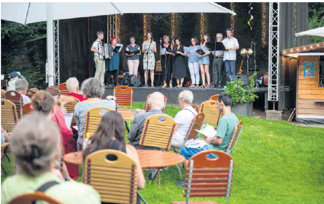
Die Sängerinnen und Sänger des „Qhor“ beim Mitsingkonzert im vergangenen Jahr.

Am 6. September um 16 Uhr werden im Engel am Dom gemeinsam bekannte Lieder angestimmt - Der Eintritt ist frei.