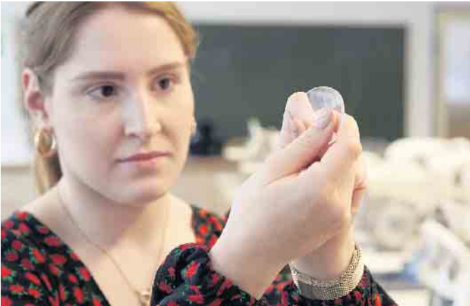
Handwerkliches Geschick und Präzision werden in der Augenoptik großgeschrieben.

Kein Tag wie der andere - warum sich der Einstieg in die Augenoptik lohnt