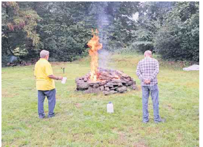
Endlich kann mal wieder ein Lagerfeuer angezündet werden.