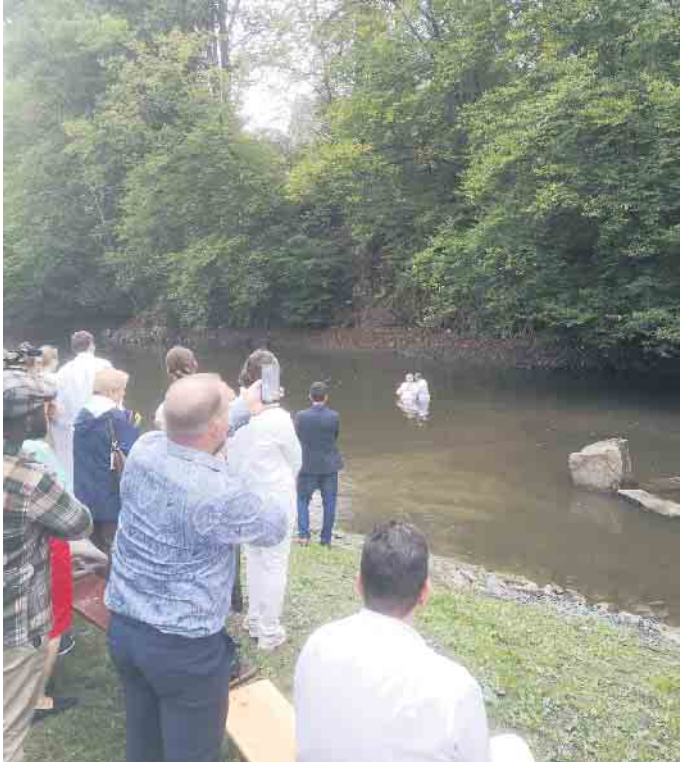
Taufe in der Sülz

Ich bin die Tür; wenn jemand durch mich eingeht, so wird er errettet werden und wird ein- und ausgehen und Weide finden. (Johannes 10,9)