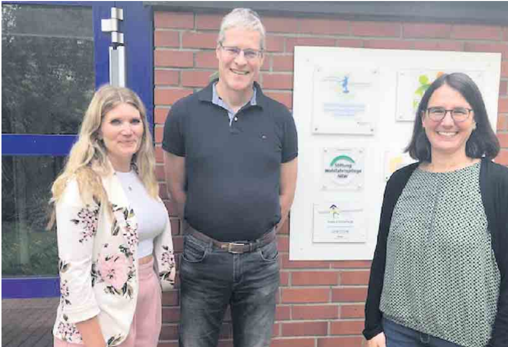
Übergabe an Kita Sülztal

Es wurden beim Paralauf am 4. Juni in Klef insgesamt 400 Runden gelaufen und die Summe von 400 Euro konnten wir nun, wie versprochen, an zwei inklusive Einrichtungen im Stadtgebiet Overath übergeben.