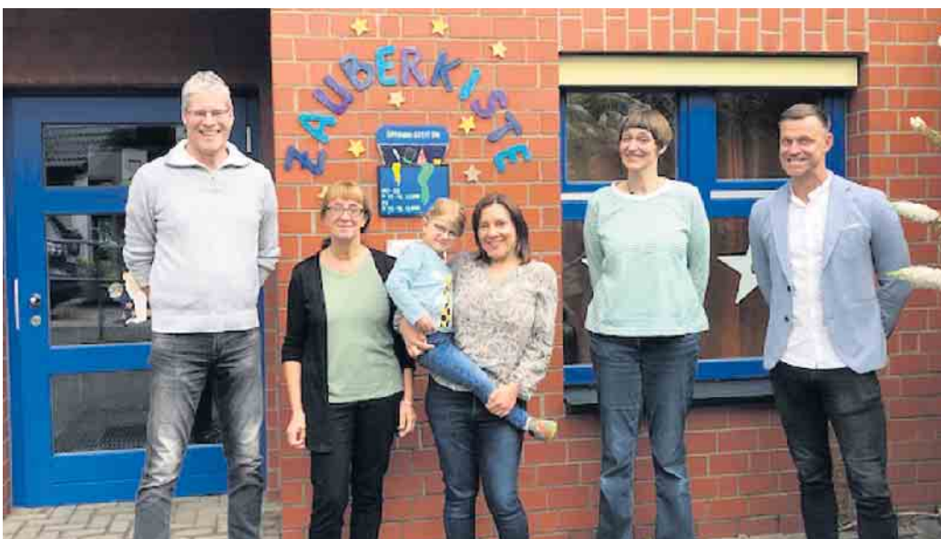
Übergabe an Kita Zauberkiste

Am 12. August um 12 Uhr startet unser Parasport-Angebot in der Halle Vilkerath . Jeden Samstag von 12 bis 13.30 Uhr Sport und Spaß für unsere Paras. Wir begrenzen das Teilnehmeralter nicht. Ansprechen möchten wir damit Kinder, Jugendliche und junge Erwachsene. Einfach anmelden unter para@sc-vilkerath.de oder vorab Infos holen auf Instagram unter @paralaufscvilkerath . Wir freuen uns!