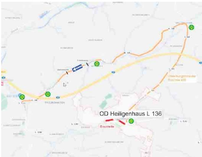
ÖPNV-Umleitungsstrecke / Ersatzbushaltestellen außerhalb OD Heiligenhaus

Alle aktuellen Fahrpläne werden ausgegangen und befinden sich auch auf der Homepage der RVK Verkehrsmeldungen ( https://www.rvk.de/fahrplaene-co/verkehrsmeldungen/linie/420 ).