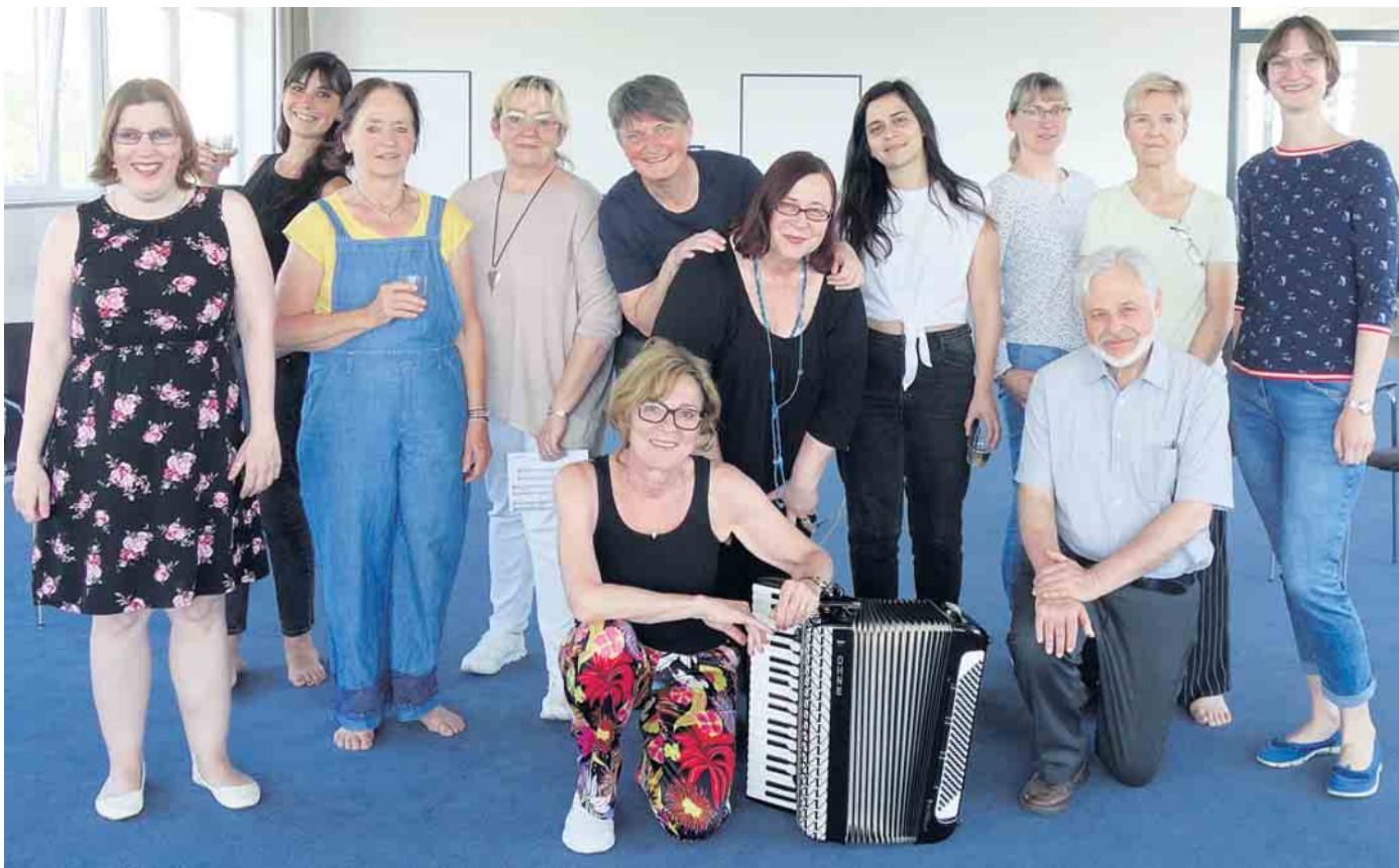
Die Sängerinnen und Sänger des EVK-Projektchors freuen sich auf viele Mitsängerinnen und Mitsänger.

Am Samstag, 19. August, um 16 Uhr werden im Kirchgarten der Gnadenkirche gemeinsam bekannte Lieder angestimmt - Der Eintritt ist frei. Der Projektchor des Evangelischen Krankenhauses Bergisch Gladbach (EVK) lädt alle Menschen in Bergisch Gladbach und Umgebung ein zu seinem ersten großen Mitsingkonzert. Am