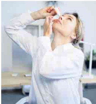
Augentropfen mit Hyaluronsäure können die Beschwerden des Trockenen Auges über Stunden gezielt lindern.

genrollen, Gähnen, bewusstes Blinzeln und den Blick in die Ferne schweifen lassen tut den Augen unterwegs immer wieder gut. (DJD)