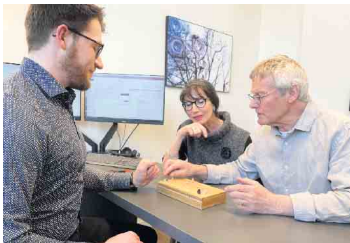
Ob nahezu unsichtbar oder mit schickem Design - moderne Hörgeräte gibt es in unterschiedlichen Bauformen, die individuell angepasst werden.