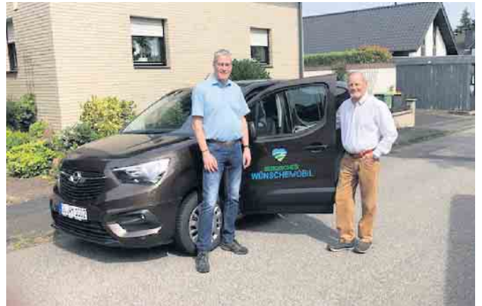
Spendenübergabe Hits fürs Hospiz e. V.