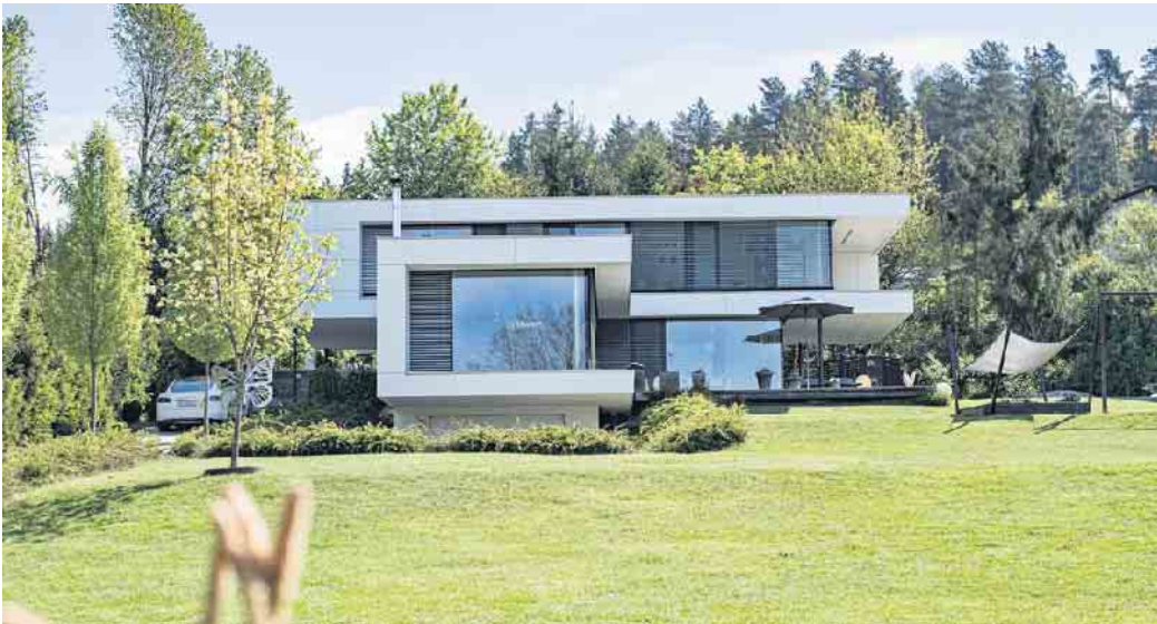
Flaches Dach, kubische Baukörper - das kommt bei vielen Bauherren gut an.