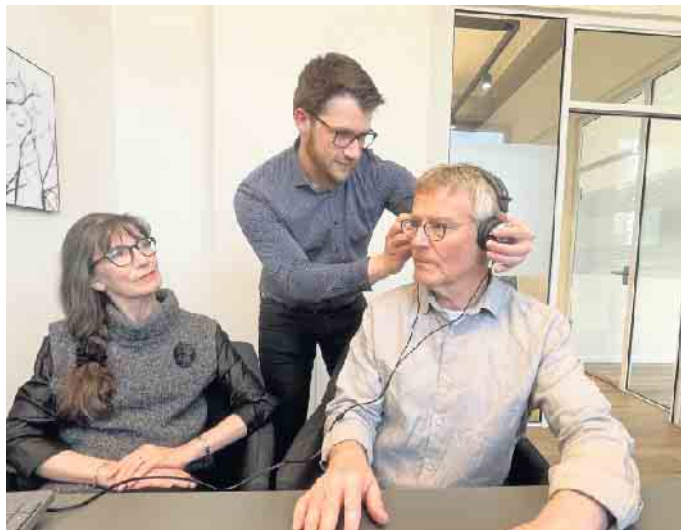
Beim Hörtest werden über Kopfhörer Töne in unterschiedlicher Höhe beziehungsweise in verschiedenen Frequenzen vorgespielt. Auch die Lautstärke der Töne variiert.

zweifelsfrei beantwortet, sollte man einen Termin für einen Profihörtest beim Akustiker in der Nähe vereinbaren. (DJD)