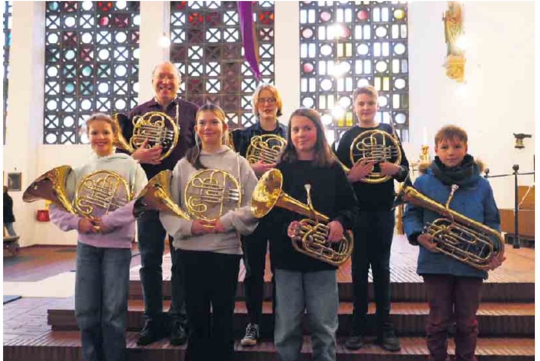
Das Horn- und Euphoniumensemble in der Kirche in Overath

Ende des letzten Jahres ist nun ein weiteres Ensemble hinzugekommen. Speziell für die Weihnachtszeit gibt es die Weihnachtsmusiker, die in einer Bläserbesetzung mit Klarinetten, Saxophonen und einem Flügelhorn weihnachtliche Stimmung bei