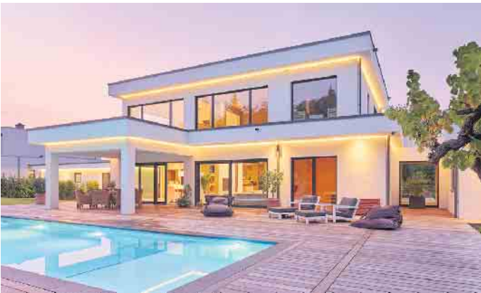
„Die Bauhausarchitektur ist Ausdruck von Individualität und Stilsicherheit.“

in die heutige Zeit, in der viele Familien zeitlich immer stärker eingespannt sind oder das Mehr an Komfort besonders schätzen. Mit einem schlüsselfertigen Holz-Fertighaus kommen sie entspannt und planungssicher in ihrem individuellen Traumhaus an“, schließt Tews. (BDF/FT)