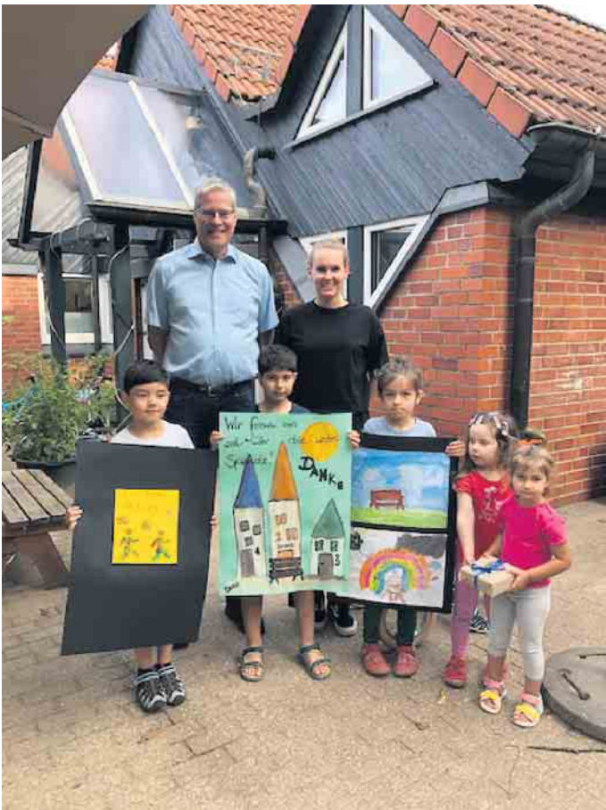
Spendenübergabe Kindergemeinschaft Sülztal e. V.

bei weiteren Paraläufen unsere Läufer:innen zu möglichst vielen Runden anfeuern, damit wieder ein kleiner Teil aus unserem oftmals privilegierten Leben zurückgegeben werden kann. Dorthin, wo vieles nicht selbstverständlich ist. Alles Gute für die Kindergemeinschaft und das Wünschemobil.