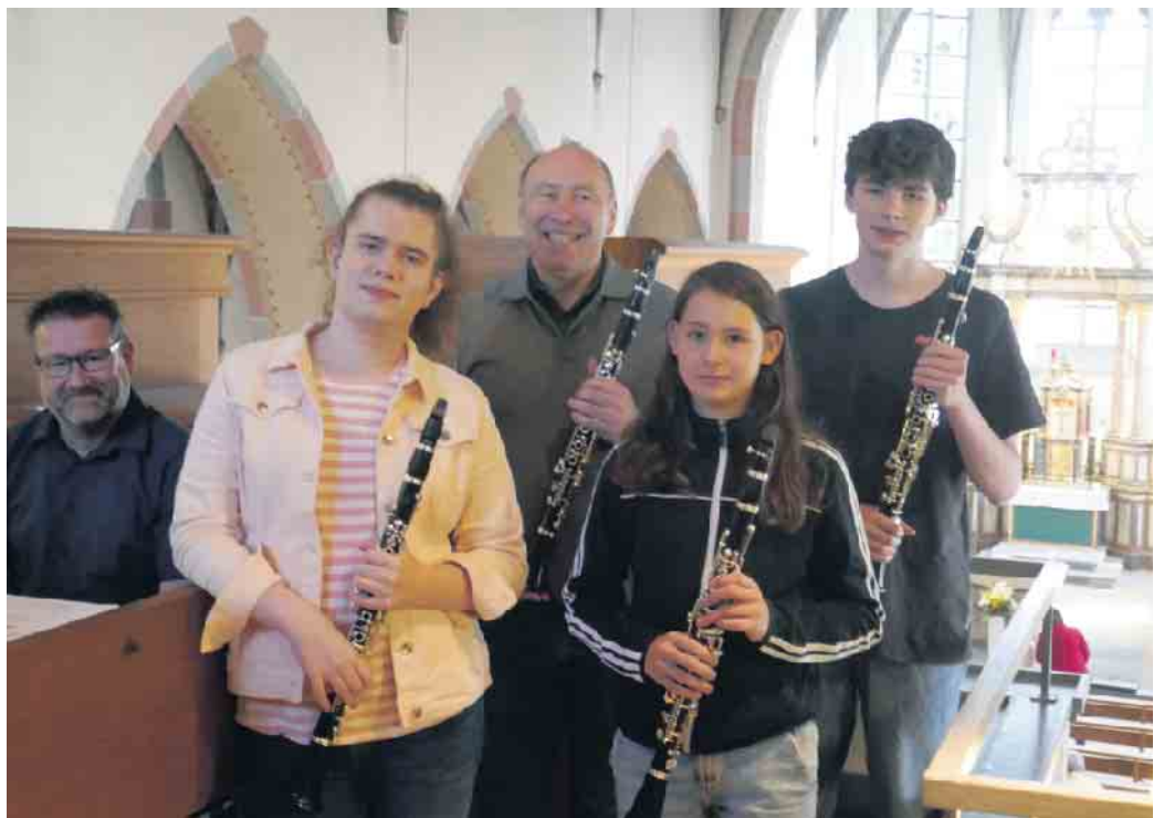
Das Klarinettenensemble bei einem Auftritt in der Kirche in Marialinden