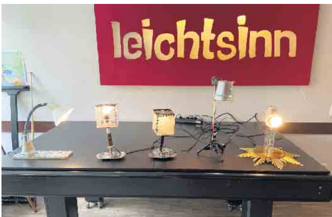
Die Lampen, die im Workshop entstanden, sind echte Hingucker.

Darüber hinaus wurde auch über Berufe aus den Bereichen Mathematik, Informatik, Naturwissenschaften und Technik und deren Perspektiven gesprochen.