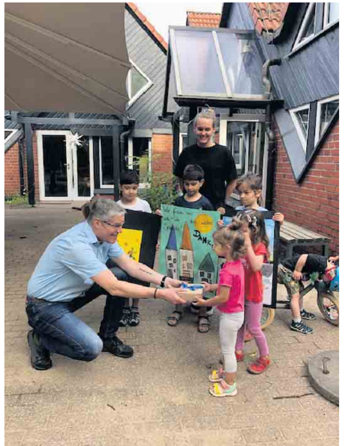
Der SC Vilkerath wird selbst beschenkt.