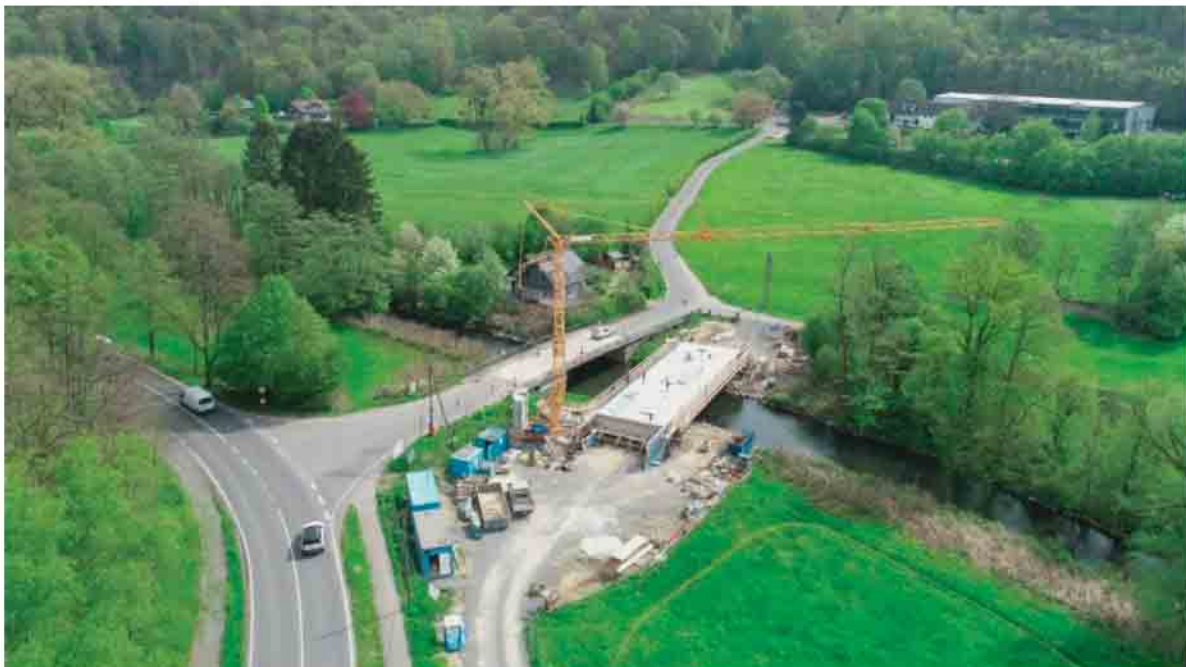
Christoph Nicodemus Bürgermeister

Die Baumaßnahme verläuft sowohl im Hinblick auf den zeitlichen Rahmen als auch die Kostenentwicklung planmäßig. Die Brücke wird demnach im November 2023 fertiggestellt sein. Dann kann der Verkehr über das neue Bauwerk frei gegeben werden, und die Situation für alle Verkehrsteilnehmer verbessert sich dadurch entscheidend.