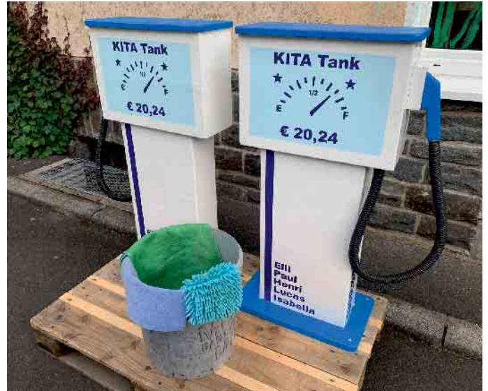
Die Bobby-Car Tankstelle in der KiTa St. Johannes

Die Angebote des katholischen Familienzentrums Much stehen allen Familien offen. Sie müssen kein Kind in einer unserer KiTas haben.