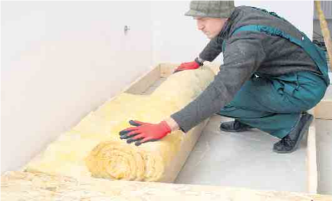
Eine Dämmung aus Mineralwolle senkt den Energieverbrauch und die damit verbundenen Kosten eines Gebäudes bei gleichzeitig verbessertem Schall- und Brandschutz. Einfache Maßnahmen können in Eigenregie durchgeführt werden.

Vom Dach bis zum Keller: Energiesparmaßnahmen in Eigenregie durchführen