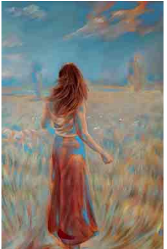
„WINDEN“ Lukrezia Krämer, 1. Publikumspreis 2022

preise. Erstmals wird auch ein Jurypreis vergeben. Die Bewerbung muss bis spätestens 1. September, möglichst deutlich früher, erfolgen. Die Bewerbung findet ausschließlich über ein Online- System statt. Der direkte Link zum Bewerbungsformular lautet: kfs.roesrath.de Wenn Sie Fragen haben oder weitere Unterstützung benötigen können Sie sich gerne an Elke Günzel, Tel.02205/802-123, E-Mail: Elke.Guenzel@roesrath.de wenden.