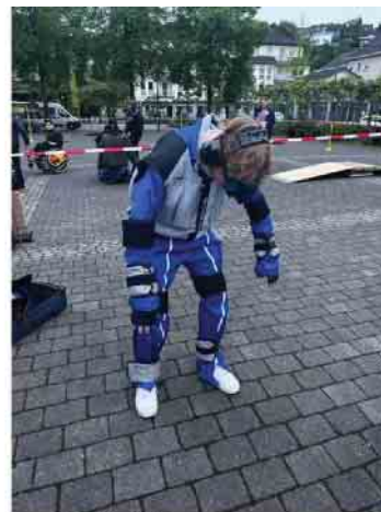
3. und 4. Bild: Schüler und Lehrer der Sekundarschule testeten den Alterssimulatoranzug und Rollstuhl-Parcours

Ein Vortrag zu den Themen Vorsorgevollmachten und Patientenverfügungen, ein Kurs zur Sturzprophylaxe und der musikalische Abschluss durch das musikalische Duo Ittel-Fernau/Kampmann („Tu was, dann tut sich was“) machten das Programm am Nachmittag zu einer gelungenen Veranstaltung. Für das leibliche Wohl sorgte das Café Auszeit. Bei einer Tasse Kaffee und hausgemachten Kuchen wurde über die Veranstaltung und Problematiken in dem Berufsfeld gesprochen.