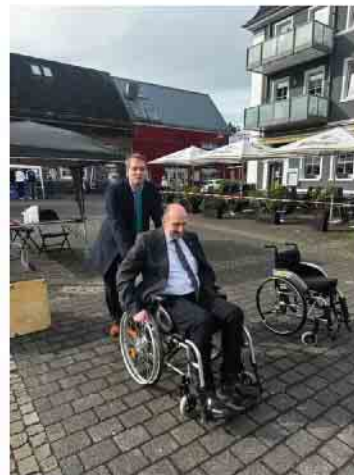
1. Bild: Eröffnung durch Bürgermeister Christoph Nicodemus 2. Bild: Beigeordneter Mario Bredow und Bürgermeister Christoph Nicodemus beim Rollstuhl-Parcours