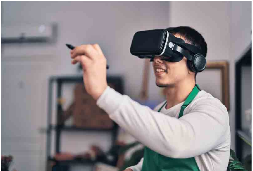
Bei der Gewinnung von Azubis setzt die Glasindustrie modernste Technologien ein. Mittels VR-Brille können Interessierte virtuell in den Beruf hineinschnuppern.

Junge Menschen finden in der Glasindustrie spannende Arbeitgeber, vom mittelständischen