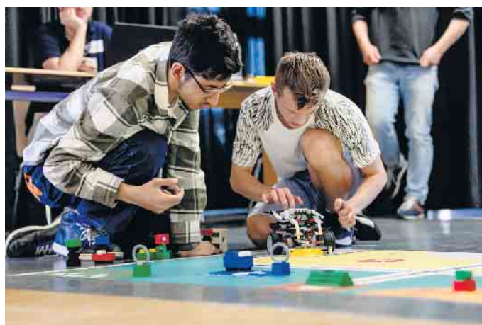
Das Team der Nelson-Mandela-Gesamtschule löste wie auch die anderen Mannschaften viele anspruchsvolle Aufgaben.