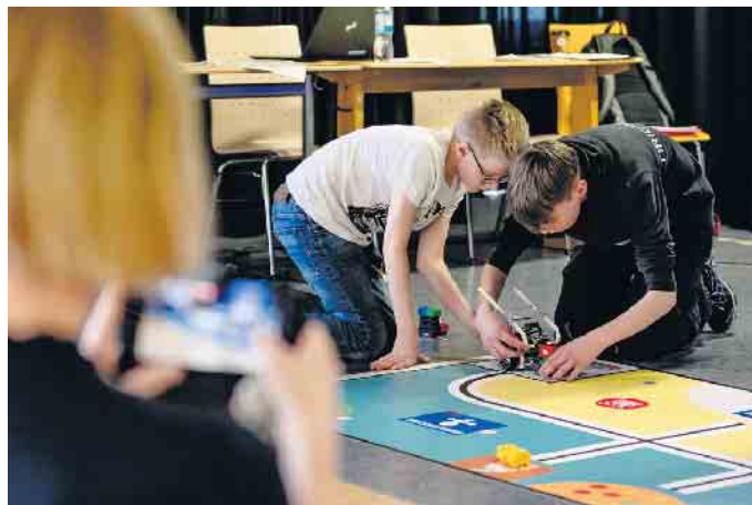
Die Mannschaft „SGL Tech 1" des Gymnasiums Leichlingen sammelte die meisten Punkte und reist nun zum Regionalwettbewerb.

So standen in den vergangenen Jahren Themen wie Digitalisierung, Raumfahrt und Weltraum, Kreislaufwirtschaft oder nachhaltige Energiewirtschaft im Fokus. In diesem Jahr lautet das Thema „Smart Cities - Städte als Lebensraum der Zukunft".