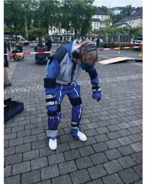
3. und 4. Bild: Schüler und Lehrer der Sekundarschule testeten den Alterssimulatoranzug und Rollstuhl-Parcours

Ein Vortrag zu den Themen Vorsorgevollmachten und Patientenverfügungen, ein Kurs zur Sturzprophylaxe und der musikalische Abschluss durch das musikalische Duo Ittel-Fernau/Kampmann („Tu was, dann tut sich was“) machten das Programm am Nachmittag zu einer gelungenen Veranstaltung. Für das leibliche Wohl sorgte das Café Auszeit. Bei einer Tasse Kaffee und hausgemachten Kuchen wurde über die Veranstaltung und Problematiken in dem Berufsfeld gesprochen.