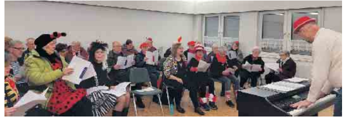
Offenes Karnevalssingen vom 6. Februar.

Gesungen werden Volkslieder, Schlager, Oldies etc. und egal ob jung oder alt, jeder kann singen, wie ihm der Schnabel gewachsen ist. Die Liedtexte werden beim offenen Singen ausgeliehen. Der Eintritt ist frei . Bei Fragen wenden Sie sich bitte an Gisela Gatz, 02204 72524.