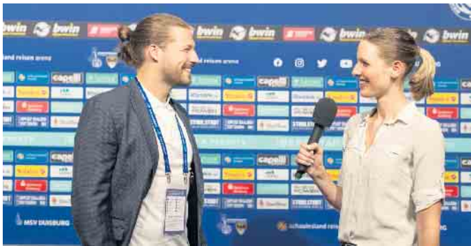
Reporter und Journalisten sind ganz nah dran an den wichtigen Leuten des Sportbusiness. Hier ist die richtige Kommunikation ausschlaggebend.