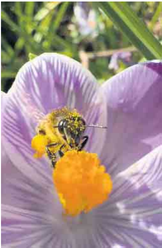
Honigbiene beim Sammeln von Pollen.

Das Tagesseminar findet aufgrund der großen Nachfrage im Saal der Taverne Kalyva, Kölner Straße 375, 51515 Kürten-Bechen statt. Die Gebühr beträgt 10 Euro. Die Anmeldung kann per E-Mail an vorstand@bienenzuchtverein-bechen.de oder über die Homepage www.bienenzuchtverein-bechen.de erfolgen. Nach Eingang der Anmeldung erhalten die Teilnehmenden eine Rechnung über die Gebühr, die Anmeldung wird erst mit der Zahlung der Gebühr wirksam. Die Kursplätze sind begrenzt! Also schnell anmelden!