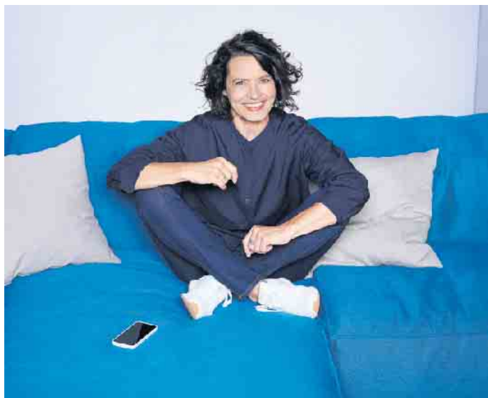
Schauspielerin Ulrike Folkerts leidet nach einem Knalltrauma unter einer Hörminderung.