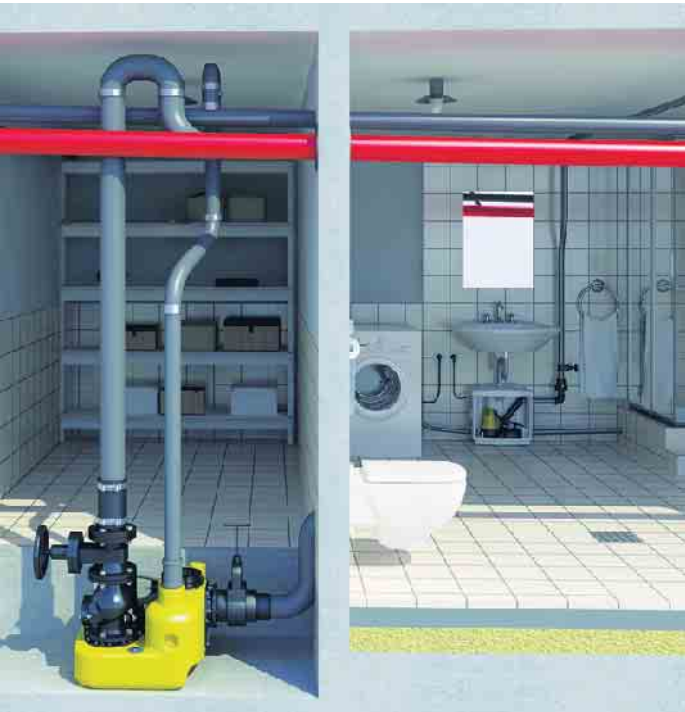
Die Hebeanlagen fördern Abwasser aus dem Keller in den Kanal und sorgen gleichzeitig für Schutz gegen Rückstau.

Und nicht zu vergessen: Wenn eine Markenpumpe verstopft oder nach vielen Jahren im harten Geschäft doch mal ein Defekt auftritt, bieten Markenhersteller wie beispielsweise Jung Pumpen einen deutschlandweiten Werkskundendienst und eine langfristige Ersatzteilversorgung. (trd/akz-o)