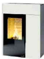
Hybridöfen auch wasserführend