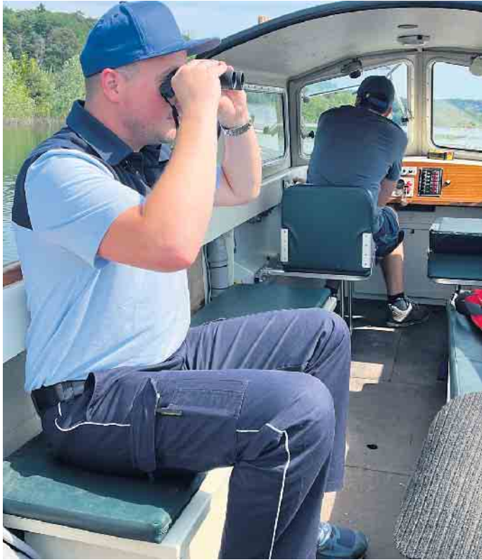
Kontrolle an Land und auf dem Wasser.