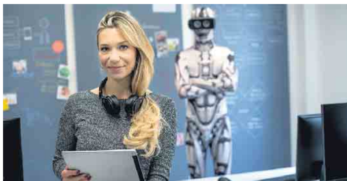
Im Master-Studiengang kann man zur Digital-Expertin werden.