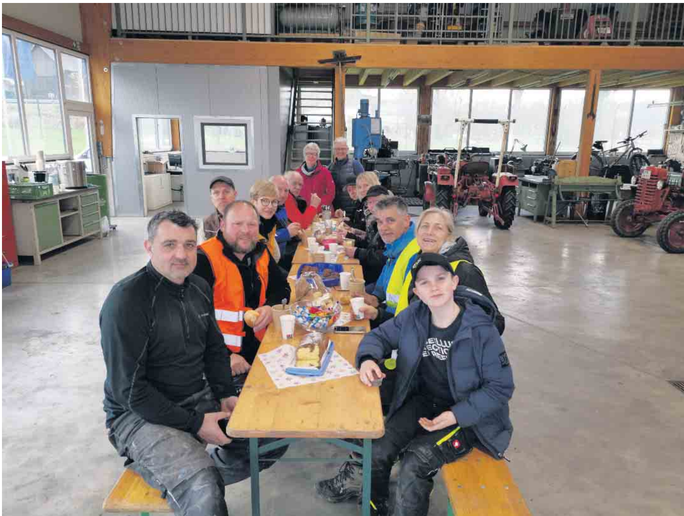
Einige der fleißigen Helferinnen und Helfer in Vilkerath