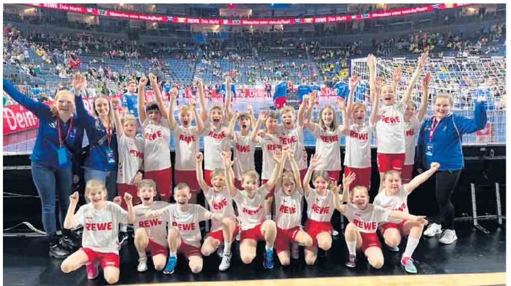
Handball E-Jugend des SSV Overath und Betreuerinnen beim Final Four in der Lanxess Arena

schon fest: „Das war so cool, hier wollen wir bestimmt nochmal hin und dann spielen wir selber mit!“