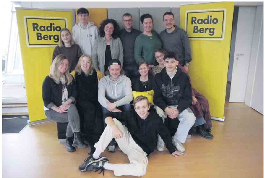
Das Radio-Berg-Team stellt sich im Studio Kürten-Herweg der Kamera