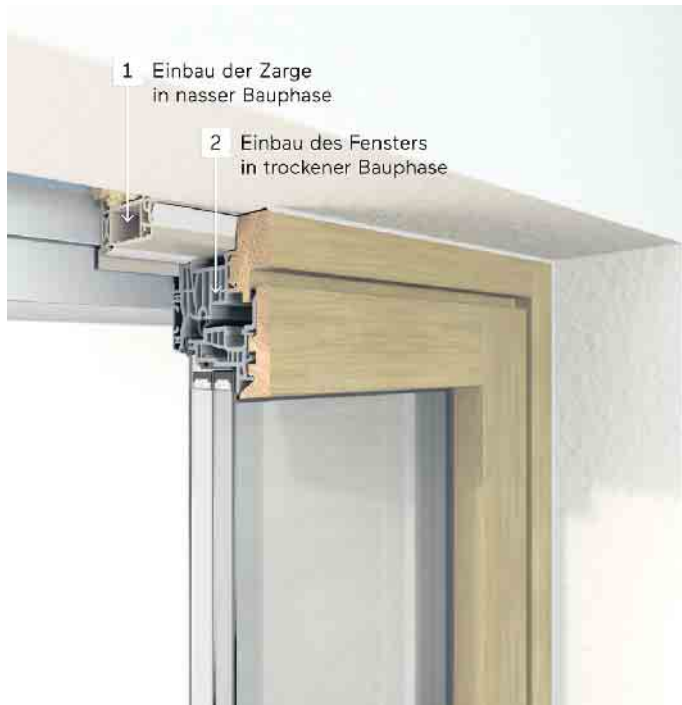
Ein zweistufiger Fenstereinbau mit Einbaurahmen bietet viele Vorteile.

Einbaurahmen, auch Zargen genannt, sind ein immer wichtiger werdendes Tool bei der Montage von Fenstern. Die Fenster müssen damit nicht schon im Rohbau eingebaut, sondern können in einer späteren Bauphase montiert werden. Bauherren profitieren nicht nur vom reibungslosen Einbau der hochwertigen Bauteile - langfristig sind zweistufige Montagekon-