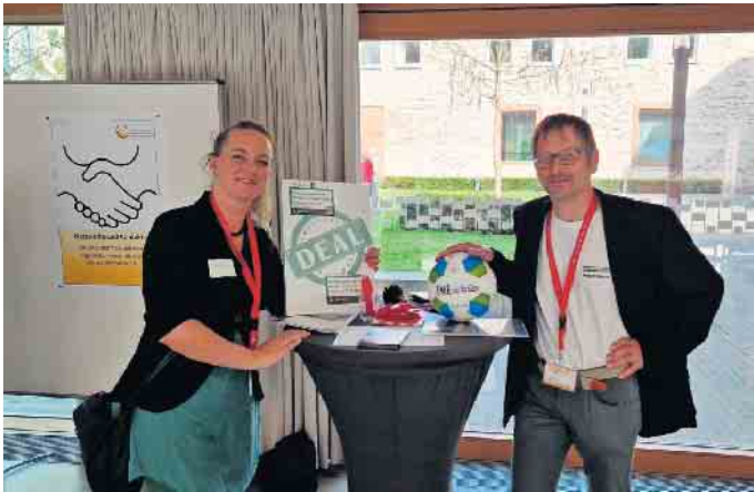
Marktplatz Gute Geschäfte 2023 in Odenthal.

Hauptsponsor Rembold prämiert erfolgreichste gemeinnützige Kooperation