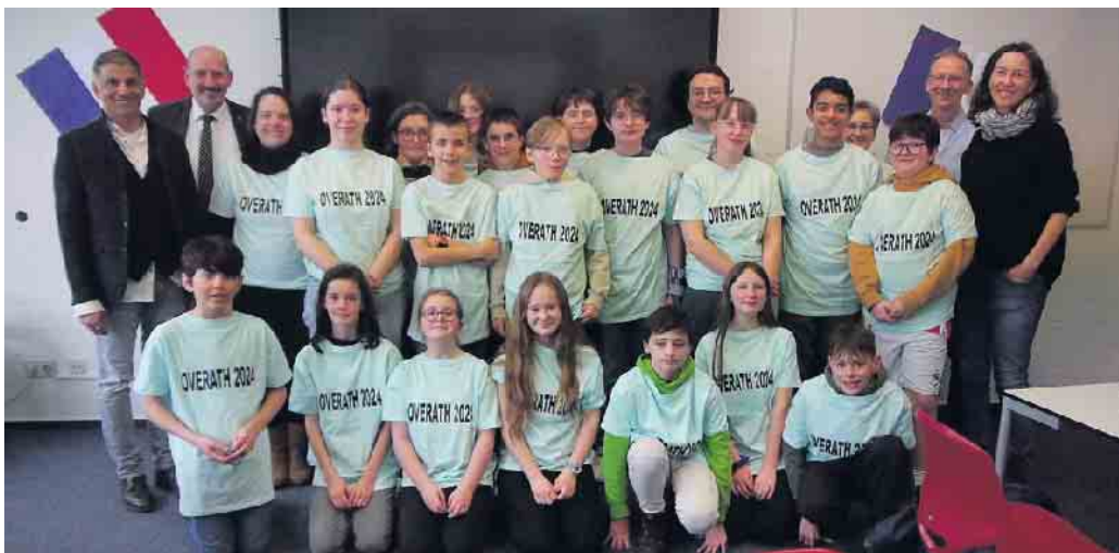
Die französischen Gäste trugen zünftige T-Shirts mit dem Aufdruck „Overath 2024“