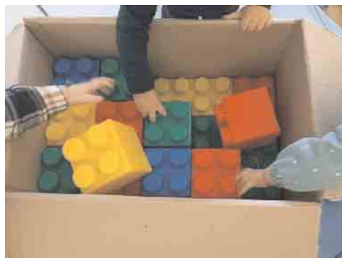
Große Freude beim Auspacken

Overath, den 11. März 2025. Die Freude war groß, als eine ehrenamtliche Mitarbeiterin des Kleiderladens vom Kinderschutzbund sich meldete, um eine großzügige Spende für die vier Gruppen der Eltern/Kindgruppen anzukündigen!