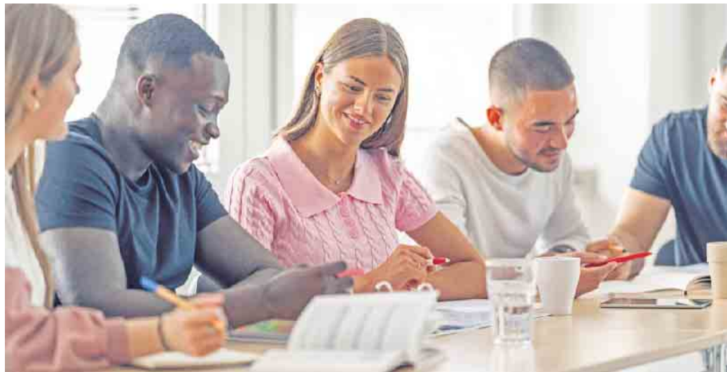
Die kompakten Lehrveranstaltungen finden in einem der Studienzentren der Hochschule statt.

Fitnessökonomie und machte sich nach Abschluss seines Studiums selbstständig. Unter www.dhfgp.de sind weitere Erfolgsgeschichten zu finden. (DJD)