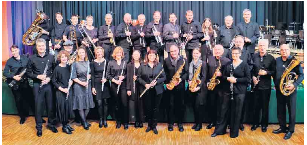
Sülztaler Blasorchester Rösrath e. V.

Wie es sich für ein „Silberhochzeits-Konzert“ gehört, erwarten Sie viele Highlights aus verschiedenen Musikrichtungen - Sie dürfen gespannt sein, welche Überraschungen wir zu-