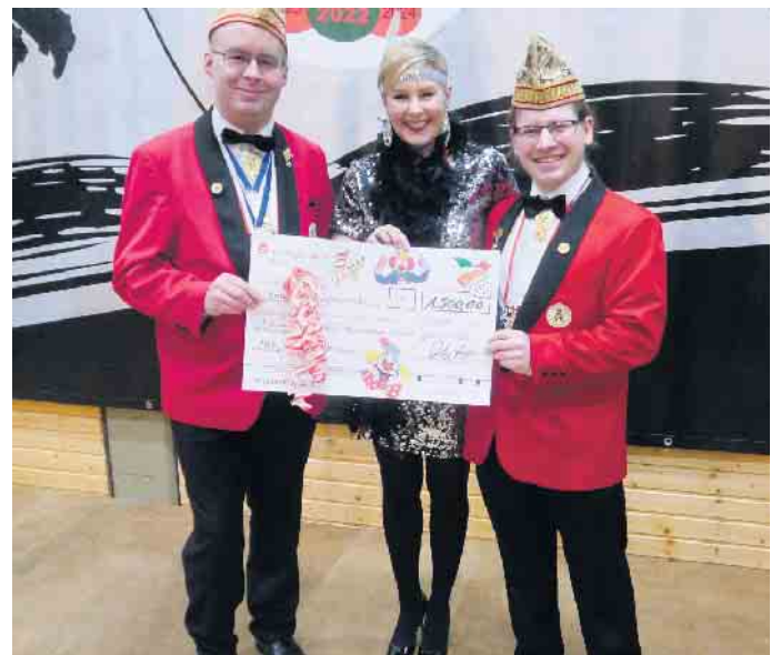
Der Scheck der Kreissparkasse kam bei den Lustigen Brüdern gut an