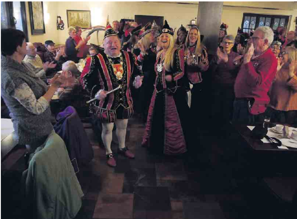
Das Marialindener Prinzenpaar wurde im Altvolberger Hof begeistert empfangen