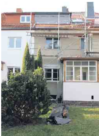
Grundlage für die Planung einer Altbausanierung ist eine gründliche Bestandsaufnahme des Hauses, am besten mit unabhängiger Beratung.

Kaufinteressent mehr Klarheit darüber, mit welchen Zusatzkosten er neben dem Kaufpreis und den Kaufnebenkosten rechnen muss. (DJD)