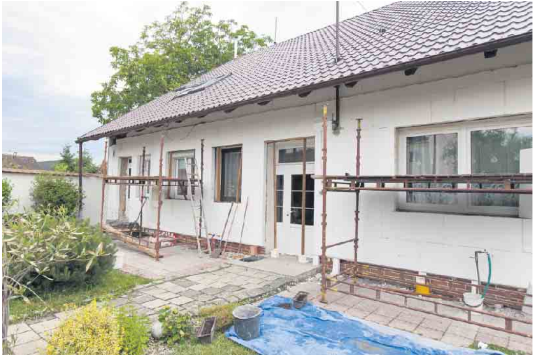
Für die Planung und Ausführung von Modernisierungen empfiehlt es sich, unabhängigen sachverständigen Rat einzuholen.

Wenn es an die Vorbereitung geht, unterstützt der Berater die Hauseigentümer auch dabei, Handwerkerangebote zu vergleichen und Baubeschreibungen zu prüfen. In der Umsetzungsphase empfiehlt sich bei größeren Maßnahmen eine baubegleitende Qualitätskontrolle. Regelmäßige Vor-Ort-Termine sichern eine korrekte Ausführung der Arbeiten und schützen davor, dass Mängel unerkannt bleiben oder erst zu spät entdeckt werden.