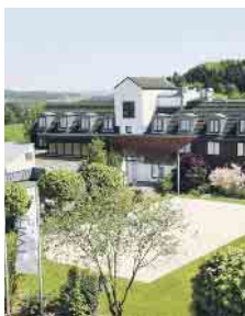
Beispiel DZ Comfort