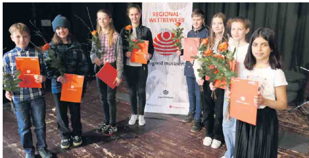
Die erfolgreichen Teilnehmer des Wettbewerbs Jugend musiziert bei der Preisverleihung