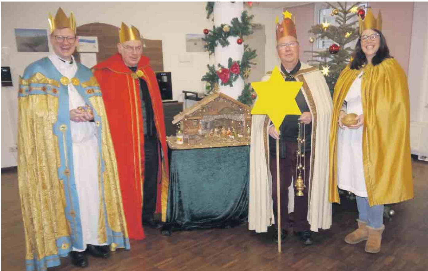
Das Seelsorge-Team an der Krippe des Seniorenheims Vita in Steinenbrück