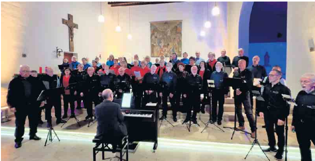
WIR mit dem Aggerchor und den Vogelsängerinnen.