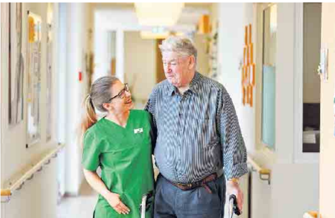
Altenpflege ist ein Beruf mit viel zwischenmenschlichem Kontakt, der sich auch familienfreundlich gestalten lässt.

ren. „Wichtig und extrem motivierend ist für mich der ständige Austausch mit den Bewohnern. Viele sind wegen ihrer Lebenserfahrung ein Vorbild für mich und geben mir täglich sehr viel.“ (DJD)