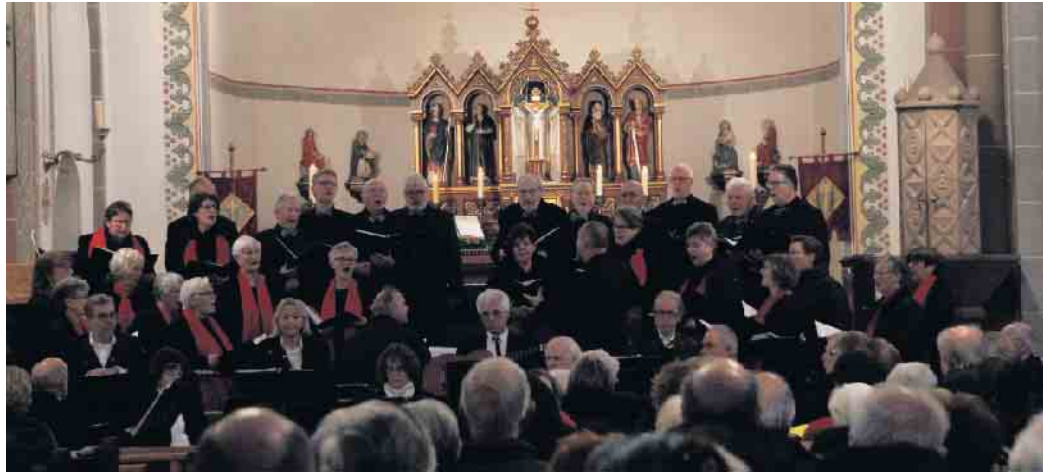
Dreikönigskonzert 2023.