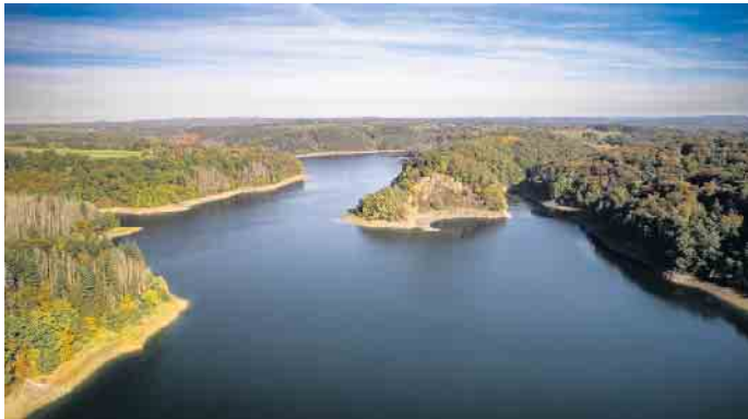
Der Bergische Weg führt an vielen landschaftlichen und kulturellen Highlights vorbei, u.a. auch an der Wahnbachtalsperre.

Der Bergische Weg schafft eine einmalige Verbindung zwischen den das Land NRW prägenden Kulturlandschaften Bergisches Land, Ruhrgebiet, Sauerland und Rheinland. Er führt auf 259 Kilometern in 14 Etappen vom Baldeneysee in Essen über den Kreis Mettmann, die Städte Wuppertal und Solingen, durch den Rheinisch-Bergischen und den Rhein-Sieg-Kreis bis ins Siebengebirge nach Königswinter am Rhein. Der qualitätsgeprüfte Fernwanderweg birgt eine über